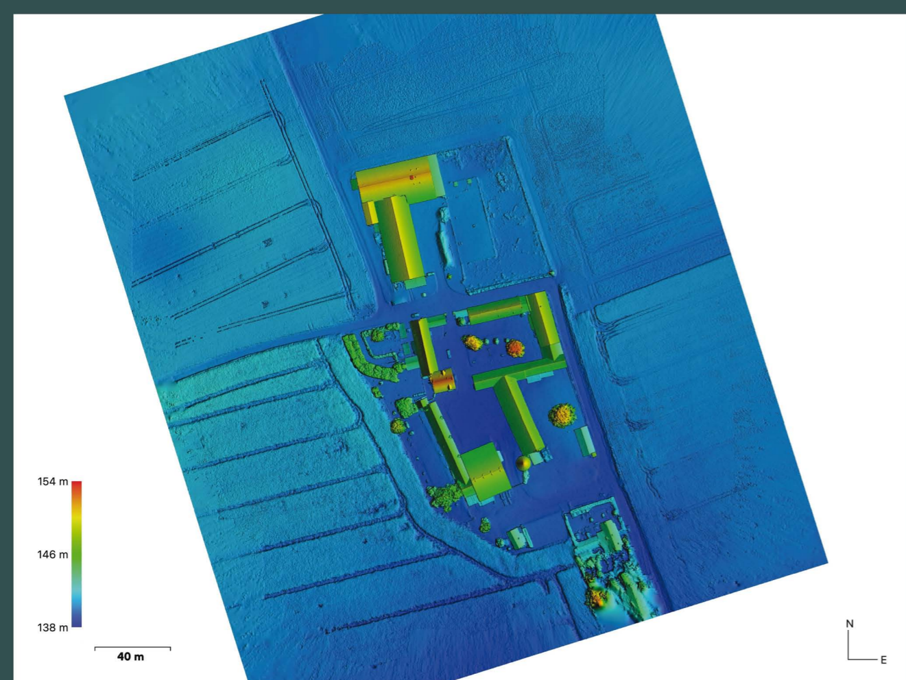
Figure 01. Ferme du Mesnil, prospection aérienne par drone, modèle numérique d'élévation reconstruit, densité des points 61,6 m 2 (P. Kervella, ARBR)

Projet d'opération programmée sur la ferme du Mesnil à Grisy-Suisnes (Seine-et-Marne), associant prospection aérienne par drone, prospection thématique avec matériel spécialisé et sondages, ce projet scientifique est à ancrer dans le travail continu de l'équipe archéologique depuis 2018 ( figure 01 ).