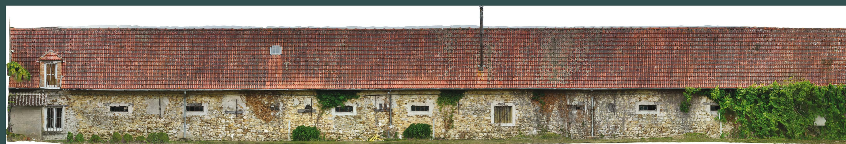
Figure 04. Ferme du Mesnil, étude du bâti, photogrammétrie par drone

En conclusion, l'opération d'archéologie programmée, tout en ayant enrichi la documentation scientifique et les mobiliers archéologiques, a permis la mise en évidence des niveaux archéologiques, notamment l'occupation antique.