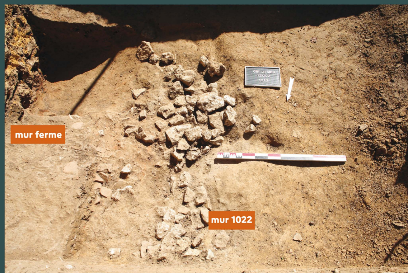
Figure 05. Ferme du Mesnil, sondage 1, les vestiges de la villa se composent du « mur 1022 », orienté Nord-Ouest / Sud-Est, en blocs calcaires mesurant une dizaine de centimètres de longueur. À cette observation s'ajoute la présence du mur de la façade occidentale du bâtiment d'élevage, aux pierres calibrées mais non taillées jointes par du mortier à base de sable jaune. Les couches de sédiment associées à ce mur sont composées d'un fossé de fondation comblé de terre compacte surmonté d'un niveau de rubéfaction

Les deux parcelles sondées ont révélé des vestiges de murs de la partie résidentielle de la villa ( figure 05 ). Les sondages ont fait apparaître une stratigraphie générale au moins des périodes récentes, époques moderne et contemporaine. Elle se compose d'une couche de terre végétale, surmontant un niveau de remblai épais constitué lors de la réfection de la toiture, au-dessus du niveau ancien du jardin du XIXe siècle.