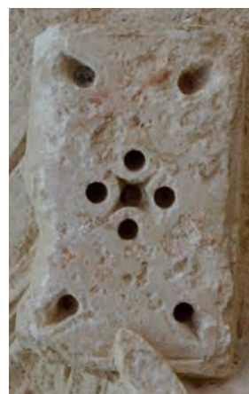
Fig.1c : Détail de l'ornementation du livre.

Le personnage tient par ailleurs dans sa main gauche un livre. Le bras replié qui le soutient accentue les plis du vêtement, ciselés et représentés avec une grande maîtrise par le tailleur.