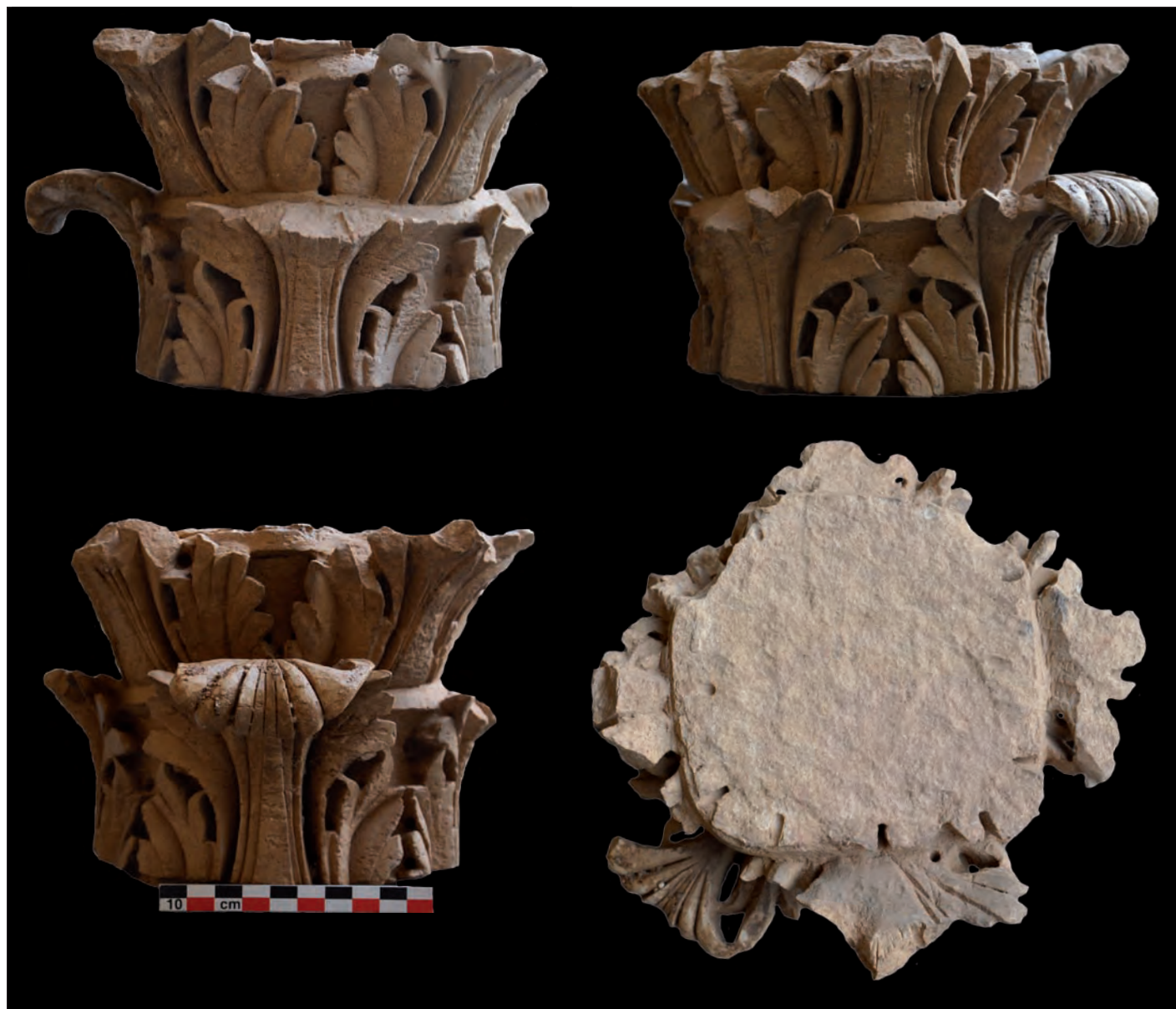
Fig.13 : Ancienne, ancienne abbaye. Chapiteau corinthisant n°30810-8.

que les comparaisons sont les plus nombreuses. L'usage du trépan ou foret notamment y est bien représenté également. Il est manifeste que des sculpteurs ont travaillé pour les deux chantiers, ce qui rehausse l'importance du foyer de création qu'animaient les deux abbayes. Les historiens jusqu'à présent ont davantage souligné, à partir du dossier des cartulaires, les rivalités et la fameuse grande querelle que se sont livrées les deux établissements, crispés notamment pendant le « moment » grégorien. N'oublions pas cependant que dès les années 1030-40 les deux abbayes avaient déjà entrepris la construction en commun du fameux pont du Gouffre Noir qui devait désenclaver cette partie de l'arrière-pays en rendant par ailleurs ce pont exempt de péages et du contrôle d'un château ou d'une église (LE