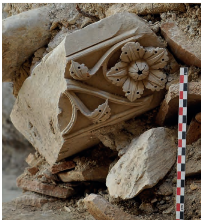
Fig. 8 : Le tailloir 23213-1 au moment de sa découverte dans les couches de destruction de la galerie.

Fragment sectionné de part en part : largeur 34 cm, hauteur moyenne 11,8 cm. La paroi décorée atteint seulement 18 x 11 cm mais laisse