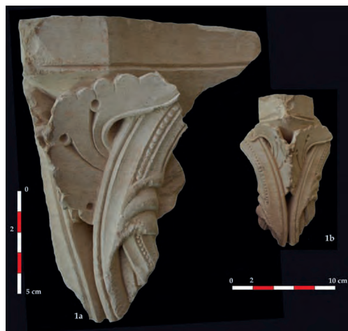
Fig. 9 : Aniane, ancienne abbaye. Fragment de chapiteau n°23212-1.

Fragment d'angle de chapiteau en proue de navire surmontant deux feuilles à marge ondulée jointes et stylisées évoquant par analogie de forme des ailes enserrées dans des arabesques