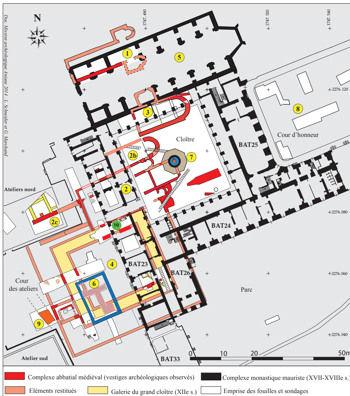
Fig.6 : Le complexe monastique d'Aniane d'après les fouilles de 2011-2015.

La tête de l'ancienne abbatale du Sauveur construite par Benoît se trouve donc aujourd'hui au centre de l'ancien cloître classique, celui que des aménagements programmés devraient bientôt rendre au public. Les nefs en revanche se poursuivent sous l'aile occidentale du cloître mauriste, dans le couloir d'accès de l'ancienne porterie classique mais encore dans le grand bâtiment des ateliers construits en 1946 seulement, au nord de l'atelier détruit durant la révolte de 1937 (fig.6).