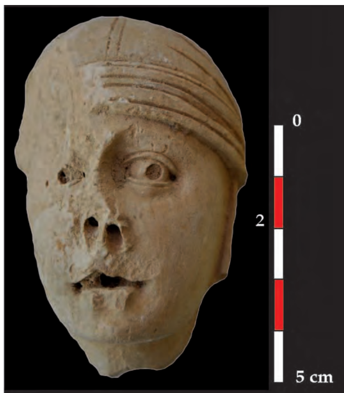
Fig. 10 : Aniane, ancienne abbaye. Tête au foulard. Fragment n°23213-11.

Petite pièce de 6,8 cm de hauteur pour 4,5 cm de large. Calcaire blanc, froid, fin.