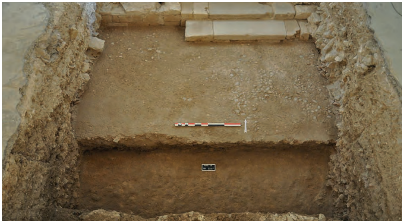
Fig.7 : Sondage 232. L'un des rares segments du cloître médiéval épargné par les travaux modernes et contemporains. Le sol de la galerie est constitué de petits galets noyés dans un mortier hydrofuge. On distingue les deux marches permettant d'accéder à l'abbatiale et, au premier plan, la tranchée d'épierrement du mur bahut.

Comme le sol de la galerie du cloître médiéval se trouvait par ailleurs plus bas que celui de l'abbatiale, ce que souligne la découverte de deux marches, ce sont ces trente centimètres de dénivelé qui nous offrent aujourd'hui les derniers vestiges inespérés de ce que fut la splendeur de l'un des cloîtres anianais (fig.7). C'est de ces couches