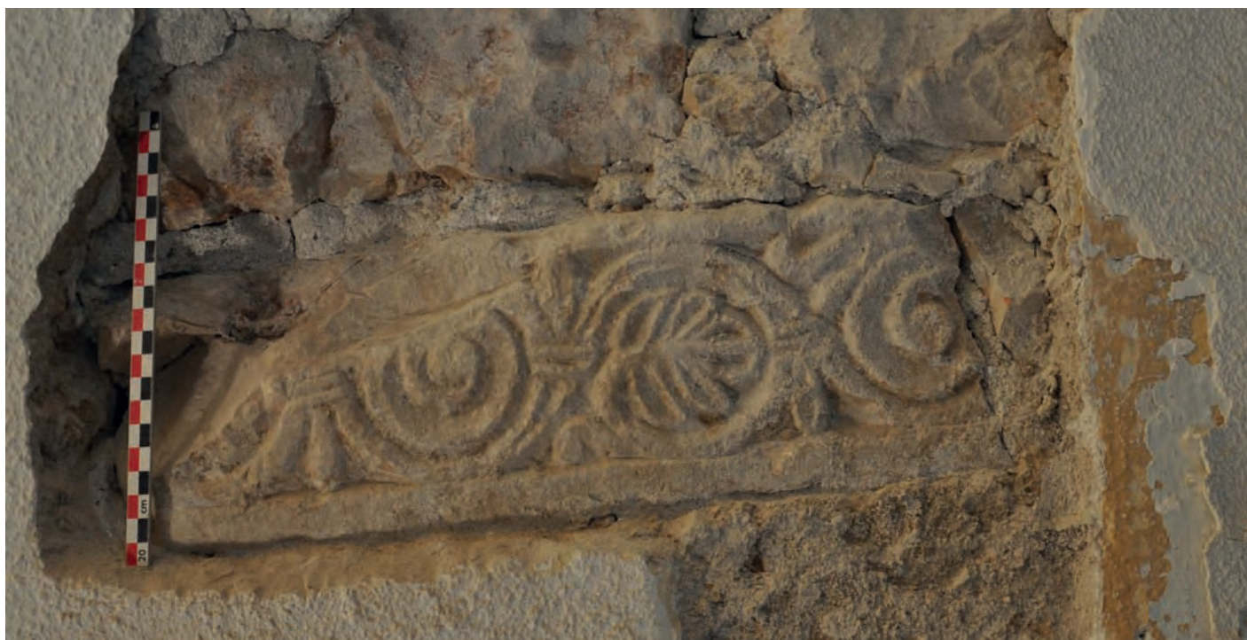
Fig.16 : Ancienne abbaye d'Aniane. Découverte en septembre 2013 d'un bloc roman en remploi dans les maçonneries du rez-de-chaussée de l'aile occidentale (dernier tiers du XVII e s.) de l'établissement mauriste.

à l'état de fragments durant ces guerres, remployées et récupérées par les villageois, mais aussi triées par les moines mauristes ou parfois remobilisées dans les constructions de la nouvelle abbaye édifiée à la fin du XVII e s., comme