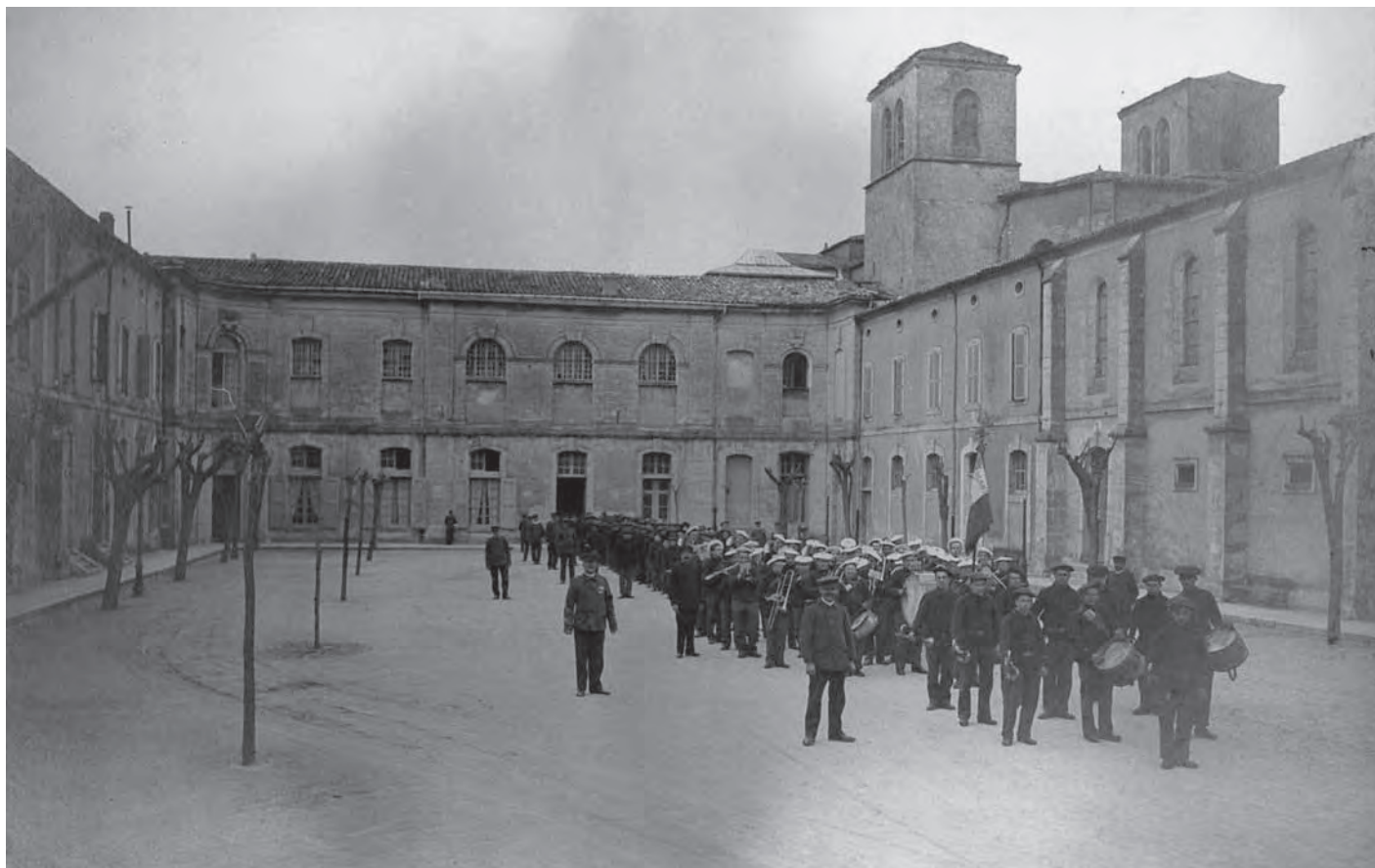
Fig.4 : Défilé des pupilles dans la nouvelle cour d'honneur de la colonie au début du XX e s. (© Inventaire général Région Languedoc-Roussillon 1991).

velles colonie agricole et industrielle pour mineurs en 1890, le ministère de la justice conserve finalement les lieux jusqu'au seuil des années 2000. L'établissement devenu un Institut Spécialisé d'Education Surveillée après la seconde guerre mondiale est définitivement fermé en 1994, tandis que l'enclos, ses sols et bâtiments sont classés Monument Historique en 2004 seulement. Laissés à l'abandon pendant une dizaine d'années néanmoins, c'est finalement la nouvelle communauté de communes (EPCI Vallée de l'Hérault) qui décide de racheter les lieux à l'Etat, en 2010. C'est dans ce contexte, anticipé par des travaux de recherches antérieures, qu'une équipe d'archéologues du CNRS est alors missionnée pour développer un programme de recherches et de fouilles.