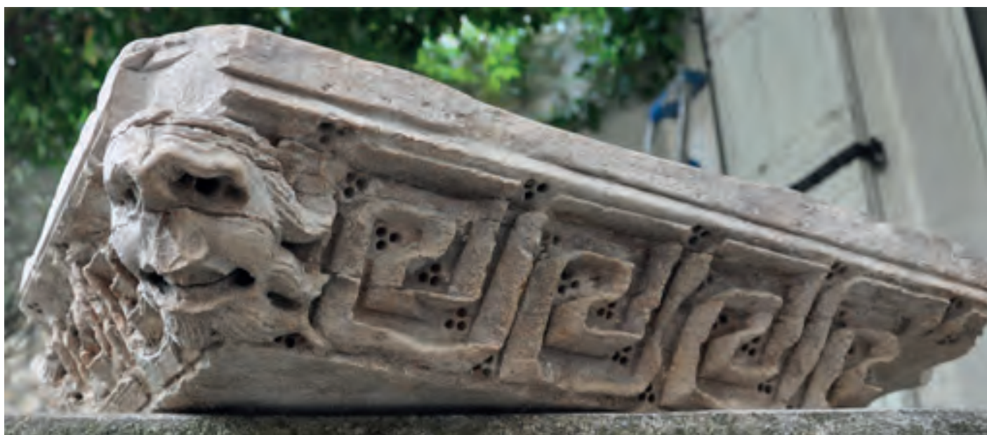
Fig.17 : Tailloir roman, inventorié par l'équipe de fouille dans une collection particulière anianaise en 2014. L'œuvre a été acquise par l'EPCI vallée de l'Hérault en juillet 2022. On remarquera l'usage du trépan et ce motif triangulaire observé également sur des pièces mises au jour dans les sondages 232 et 308.

et Montpeyrroux. Celles d'Aniane ont été décontextualisées et dispersées deux siècles plus tôt cependant, soit depuis les guerres de Religion. Leurs traces et trajets sont de fait plus difficiles à déterminer. Beaucoup ont été détruites, réduites