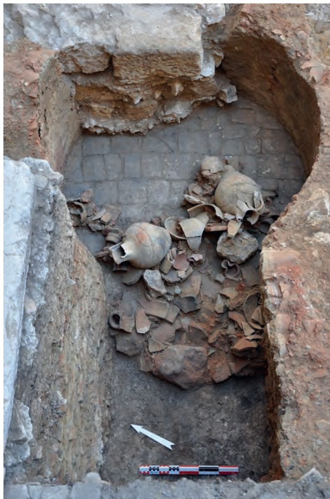
Fig.3 : A la fin du XVI e s et au seuil du XVII e s., des familles de potiers établissent leur four dans les ruines de l'abbaye, ici à quelques mètres seulement au nord-est de l'ancienne abbatale du Sauveur. (Cliché CNRS, L. Schneider 24 octobre 2011).

Un autre événement politique essentiel qui est désormais celui d'un changement de régime historique devait néanmoins modifier une fois encore profondément la trajectoire de l'établissement.