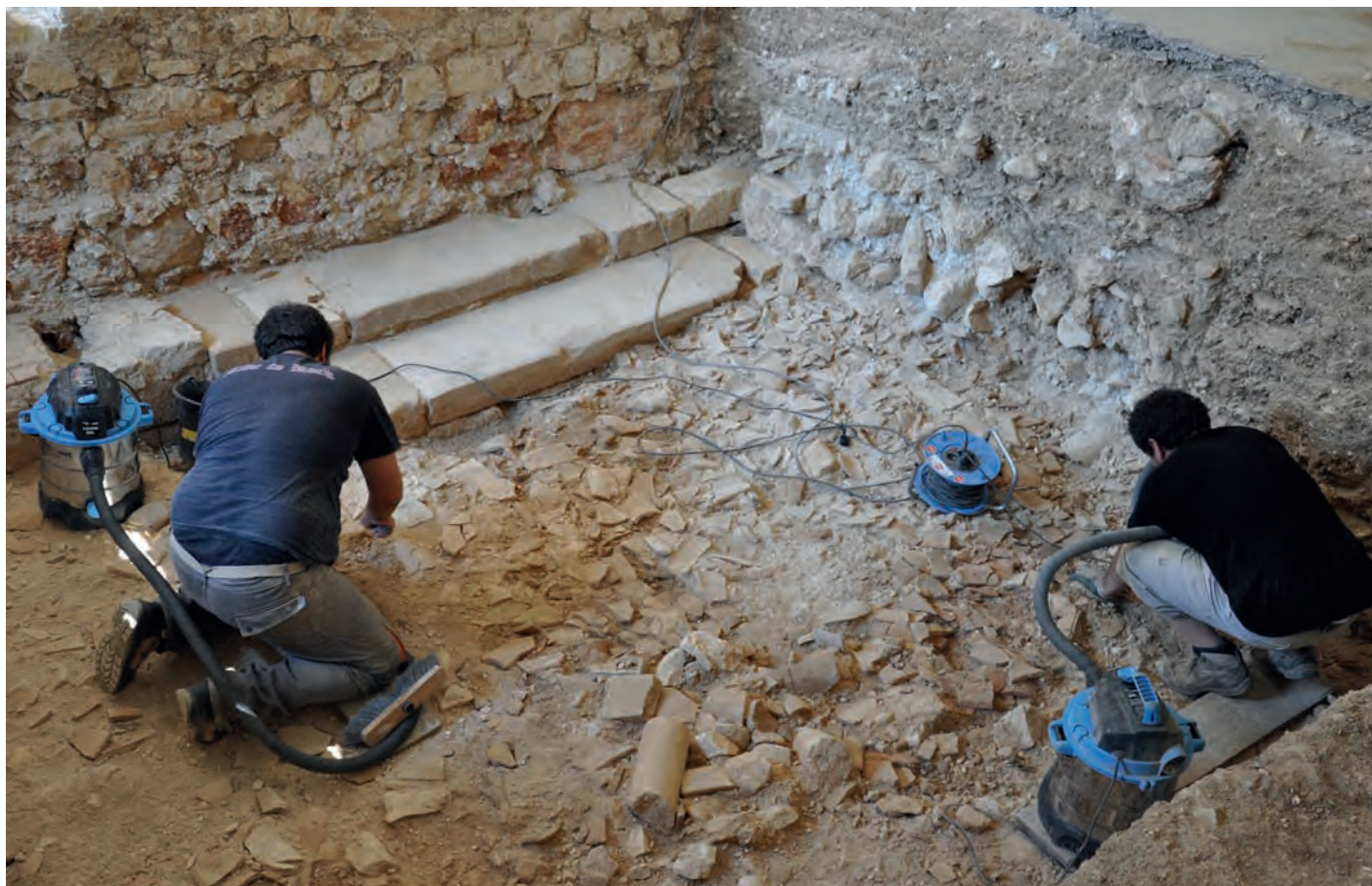
Fig.2a et 2b : Sondage 232. Ci-dessus, la couche de destruction de la galerie nord du cloître d'Aniane en cours de fouille (9 juillet 2013). Ci-dessous, l'unité stratigraphique 23214 entièrement dégagée. On distingue les deux marches permettant d'accéder à l'abbatiale, la couverture de tuiles qui suggère que la galerie devait être charpentée ainsi que des fragments de colonnettes. La couche de destruction qui a été fouillée par des récupérateurs de matériaux est un témoignage des destructions opérées à partir de 1561 dans le contexte des guerres de Religion.