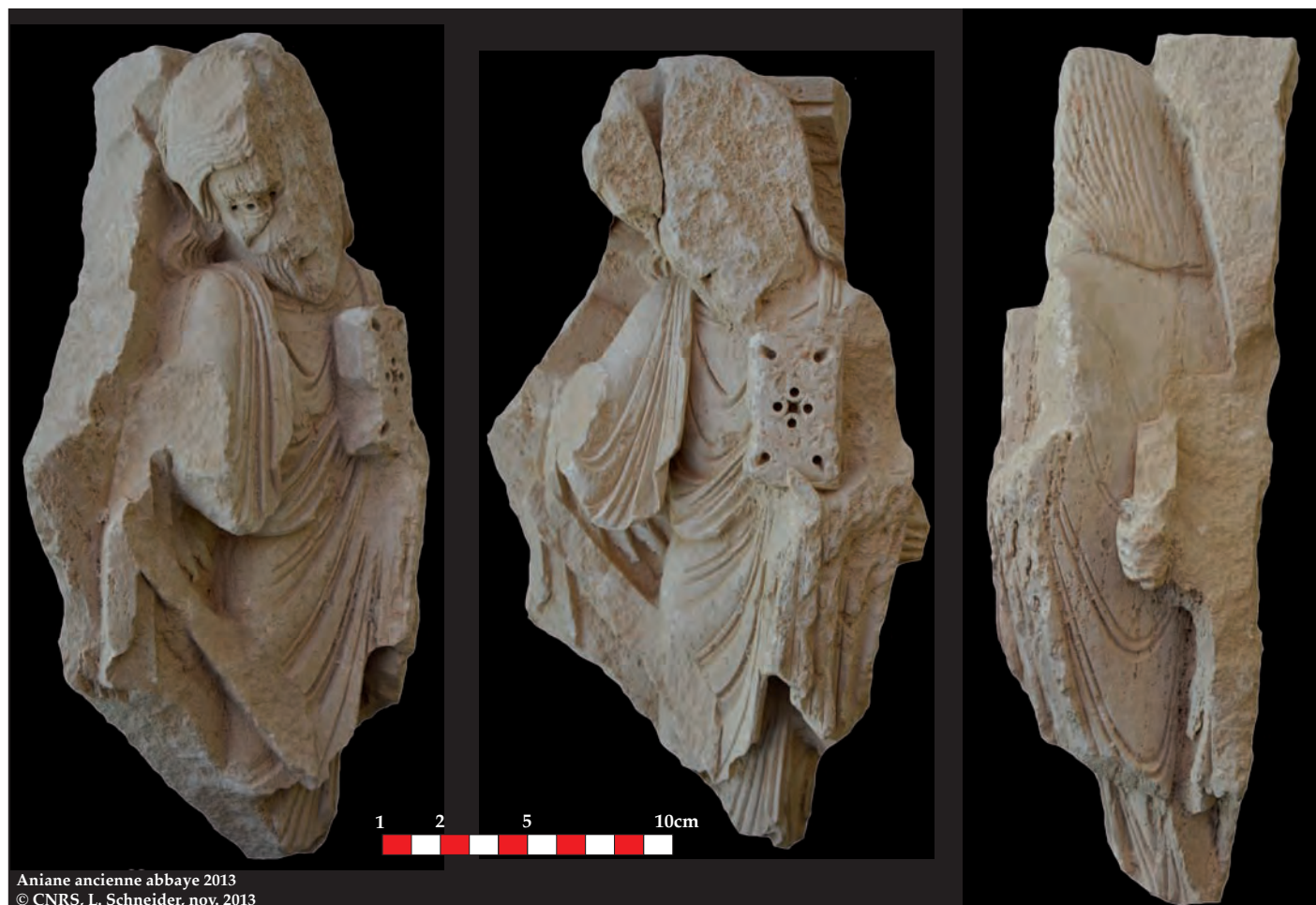
Fig.1a : Aniane, ancienne abbaye. L'apôtre découvert lors des fouilles de 2013. Inv.23213-9, inscrit MH le 28/12/15. (Document CNRS, L. Schneider).

sions. Bien que mutilée, on identifie le visage d'un homme à longue chevelure et barbe finement exécutées. La tête est inclinée vers la droite et l'on distingue encore sensiblement son œil droit préservé des mutilations, peu ou prou empathique avec ses détails miniaturisés (fig.1b).