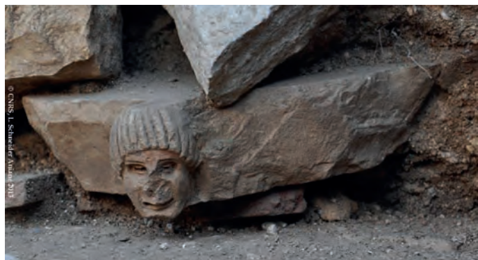
Fig.12a : Le chapiteau 30810-7 dans le contexte de sa découverte. On distingue au premier plan, le dernier sol du cloître médiéval d'Aniane.

Une troisième face (C) montre les traces d'arrachement d'un autre visage possible en partie centrale. On note ici cependant la même ornementation du bandeau supérieur au moyen de percements circulaires de 0,9 cm de diamètre.