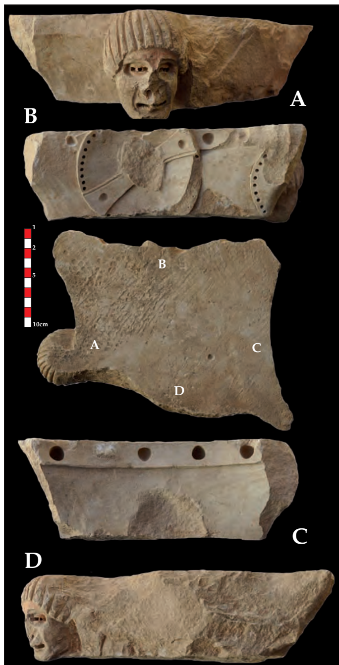
Fig.12b : Aniane, ancienne abbaye. Fragment de chapiteau n°30810-7.

Mission archéologique CNRS, L. Schneider 2013.