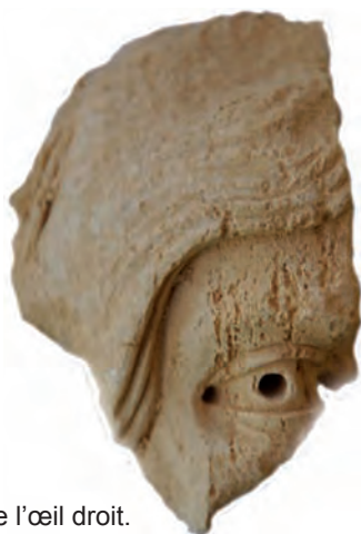
Fig.1b : Détail de l'œil droit.

Le livre exposé et mis en scène est lui aussi d'un traitement remarquable, peu commun dans le détail, rehaussé par quatre petits creusements en virgule ou en larme, aux angles, tandis que quatre autres perforations circulaires dessinent une étoile à quatre pointes au centre (fig.1c).