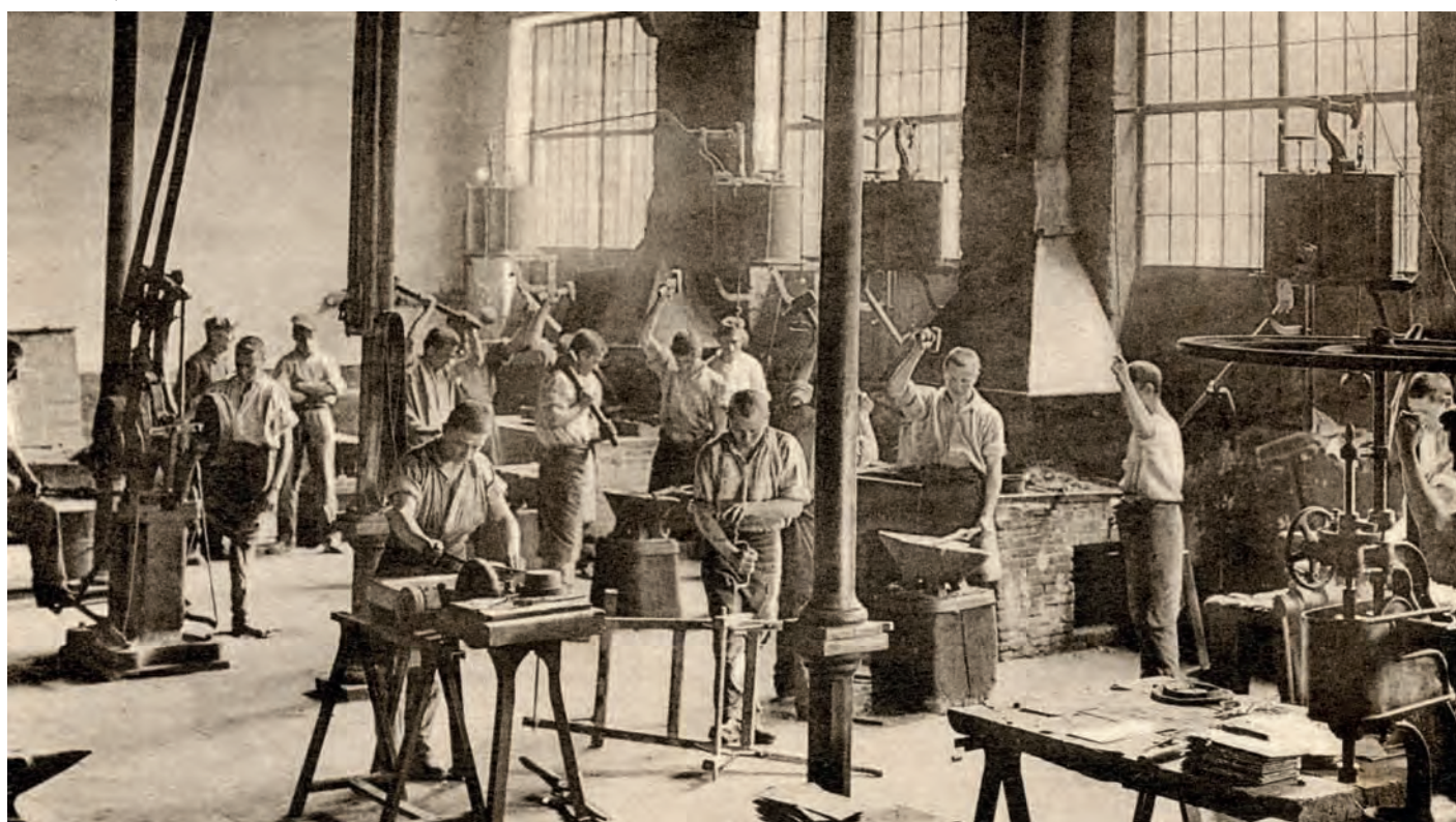
Fig.5 : Aniane. Maison d'Education surveillée. La forge. L'atelier a été détruit et incendié lors de la révolte de 1937. Les fouilles de 2011 ont permis de déterminer que celui-ci semi-enterré avait malheureusement détruit les vestiges de l'angle nord-ouest de l'ancien cloître roman et une bonne partie de la galerie septentrionale. (CPA, collection particulière Jocelyne Ollier).

Arrêter le temps ou le séquencer pour en reconstruire des tableaux circonstanciés et pouvoir le restituer pas à pas est une méthode de l'archéologie. De fait l'objet (le fragment de sculpture) de cet article se place et nous déplace donc désormais bien plus haut dans le temps, soit dans les dernières décennies du XII e s.