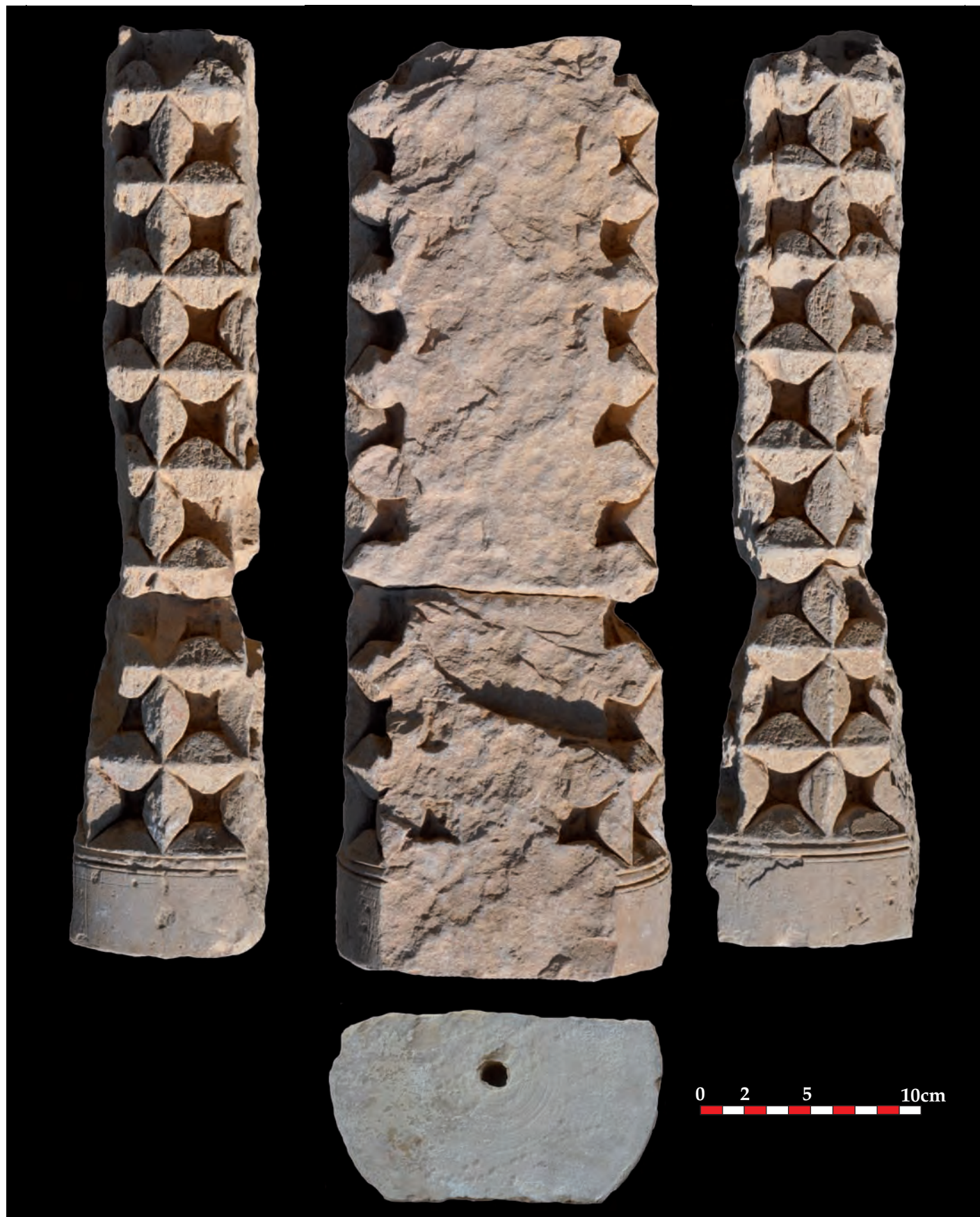
Fig. 11 : Aniane, ancienne abbaye. Fragments de colonnette n°23213-2 et 4. Mission archéologique CNRS, L. Schneider 2013.

Une autre face (A) du chapiteau conserve en partie centrale une tête humaine grimaçante ou pleurante, à la bouche entrouverte, aux yeux creusés