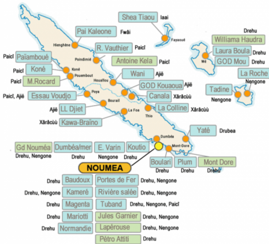
Carte de l'enseignement LCK dans les établissements privés du 2nd degré