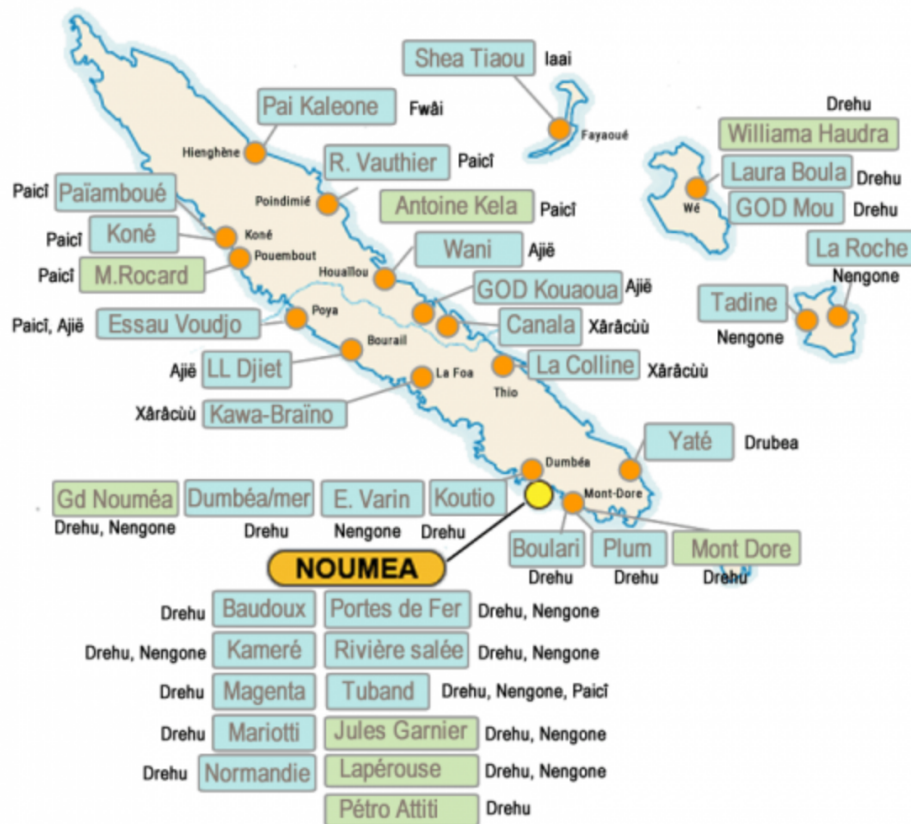
Carte de l'enseignement LCK dans les établissements privés du 2nd degré