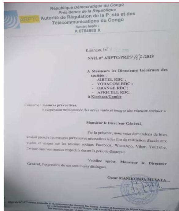
Photo n° 1 : Illustration de la lettre demandant les coupures d'Internet.

Pendant le processus électoral de 2018, l'Internet a été suspendu au début des opérations de dépouillement le lundi 31 décembre. Cette demande a été faite par le courrier suivant :