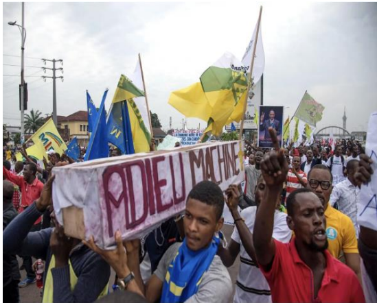
Photo n° 2 : Des partisans de l'opposition réunis à Kinshasa portent un cercueil disant « Adieu à la machine à voter » pour protester contre un processus électoral qu'ils estiment frauduleux.