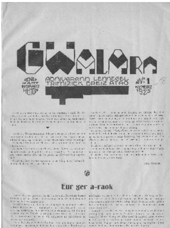
Couverture du premier numéro de Gwalarn.

En Bretagne, le mouvement le plus significatif de cette renaissance (et qui a réalisé la production théorique et littéraire la plus conséquente) est celui développé de 1925 à 1944 autour de la revue littéraire Gwalarn (« Noroît »).