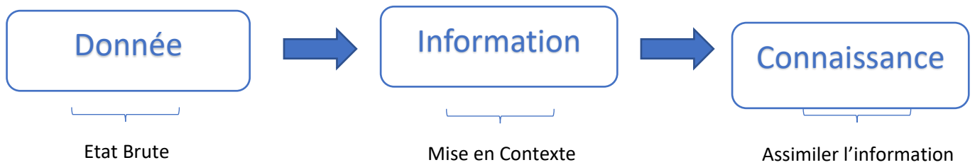
Figure 1 : Articulation Donnée – Information - Connaissance