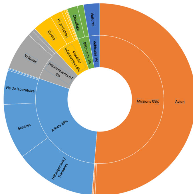
Figure 1 : Répartition des émissions de l’UMR Innovation en 2022 en pourcentage du bilan total

le train soit utilisé pour plus de 50% des déplacements professionnels et l’avion pour environ 40%, la quasi-totalité des émissions des missions provient des déplacements en avion ( Figure 1 ). Parmi ceux-ci, les trajets longue distance ont un impact majeur ( Figure 2 ). Alors qu’une majorité de trajets en avion fait moins de 1000km, ceux ayant les émissions de GES les plus importantes font entre 8000 et 10000km, soit la distance entre la France hexagonale et l’Amérique du sud, l’Afrique du sud ou l’Asie. Les achats, contrairement à la moyenne des unités dans Labos 1point5 [9], ne sont pas le poste majoritaire du BEGES de l’UMR Innovation. Ceci s’explique par l’absence de matériel scientifique et de laboratoire, inhérent aux activités d’expérimentation ou d’observation. Les émissions du poste « achats » proviennent ici principalement des services, des hébergements et des achats concernant la vie du laboratoire, i.e. de petits mobilier, d’alimentation pour les pots et buffets etc. ( Figure 1 ). Le covoiturage pour les déplacements domicile-travail est relativement répandu : près de la moitié des trajets dont la distance est comprise entre 20 et 50km se fait à deux. Enfin, l’usage des véhicules de service s’est développé entre les deux années : la distance totale parcourue avec ces voitures et le nombre de voitures électriques ont augmenté.