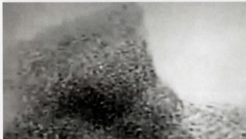
Daphné Le Sergent, Mythographe I, Noé , 2014, 3'53"

J'ai ici quelques exemples d'images fixes que j'ai essayé de travailler dans une fluidité. Les images, ainsi proposées, se présentent à la croisée de multiples chemins, d'une infinité de sinuosités et trajectoires oculaires comme si le regard se tenait perdu, indécis. Un incertain passage où l'image s'équilibre entre ses formes solides et leur dissolution dans le mouvement général de la composition. On se fait souvent de la mémoire l'image d'une ou de plusieurs boîtes dans lesquelles consigner les éléments solides du souvenir.