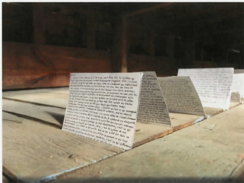
Installation Vers , SeMA Storage, 2018