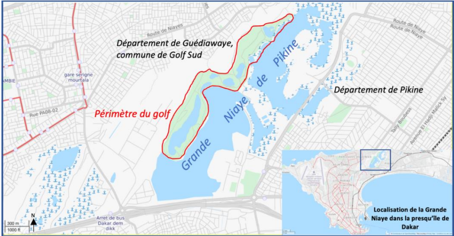
Carte 1 : Localisation du périmètre du golf dans la Grande Niaye de Pikine, commune de Golf Sud, département de Guédiawaye, agglomération dakaroise

Club de Dakar avec comme maître d'ouvrage l'État sénégalais, l'architecte Michel Gayon a mis en œuvre le plan d'un golf de 18 trous de 80 hectares, dans la Grande Niaye de Pikine, à hauteur de la commune de Golf Sud.