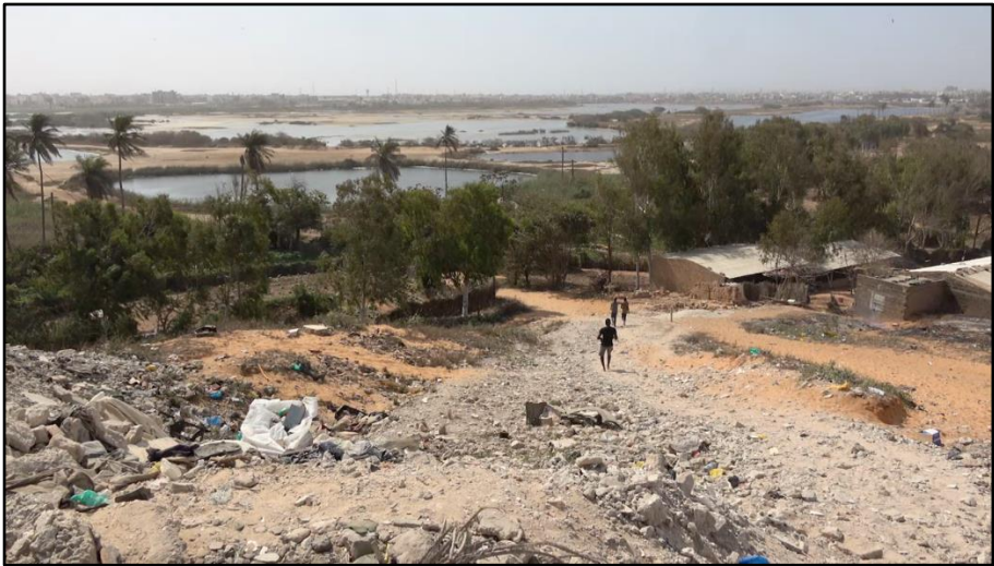
Photo 1 : Talus avec déchets et gravats, et vue sur les Niayes depuis Golf Sud, lacs naturels et artificiels

En 2018, depuis la corniche de Golf Sud, nous contemplons, Kader, Sarah, des étendues d'herbe et de sable et une décharge à ciel ouvert, qui s'étend sur les pentes.