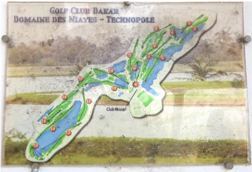
Image 1 : Plan du Golf-Club de Dakar-Technopôle, pavillon du Golf-Club Image du film en création En répondre , S. MEKDJIAN & K. NDONG, 2018