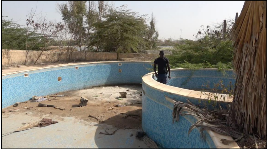
Photo 5 : La piscine du Golf-Club de Dakar-Technopôle Image du film en création En répondre , S. MEKDJIAN & K. NDONG, 2018

des aménagements touristiques intégrés des Almadies à Dakar et de la Petite Côte. La création de ruines, par abandon plus ou moins forcé ou volontaire de ces projets, qui entraîne une baisse temporaire du coût du foncier, est un élément central dans les processus de dévalorisation-revalorisation, par spéculation.