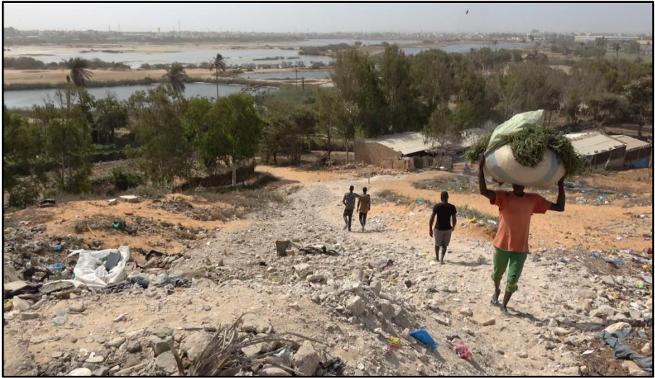
Photo 2 : Collecte et transport d'herbes fourragères, talus avec déchets et gravats, vue sur les Niayes depuis Golf Sud

pratiqué toute l'année (Diop, Faye & Sow, 2019). Avec le maraîchage, sont aussi récoltés des cocos, des manges, des bouyes, ainsi que prélevées des herbes de fourrage nécessaires à l'élevage (photo 2), ou encore des plantes et écorces à vocation médicinale. Le Ministère de l'Environnement et du Développement Durable recensait, en 2018, 600 personnes travaillant directement dans les Niayes, en lien avec les ressources végétales, animales et agricoles (MEDD, 2018).