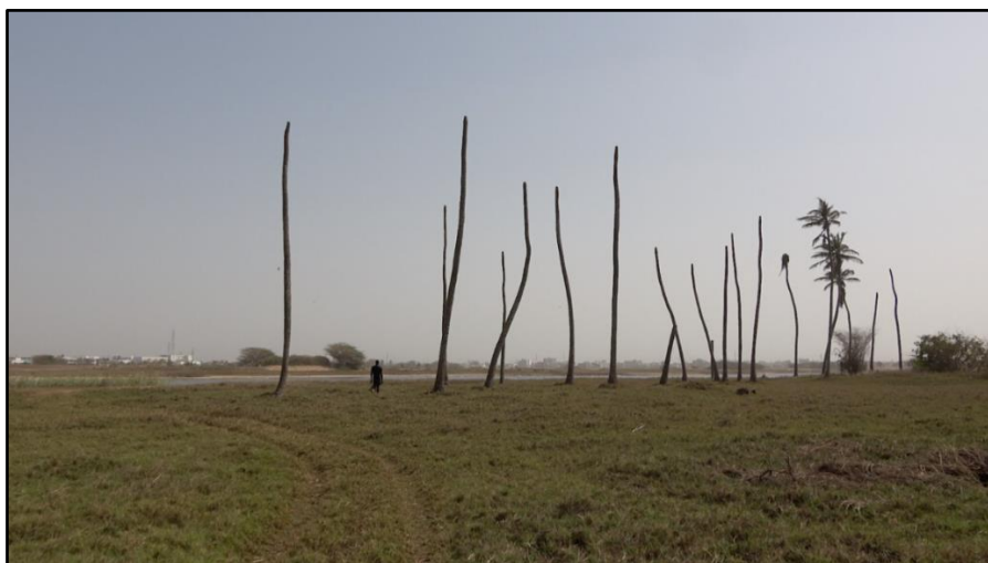
Photo 4 : Cocotiers morts, à l'ouest du périmètre du golf, avec Kader Ndong Image du film en création En répondre , S. MEKDJIAN & K. NDONG, 2018