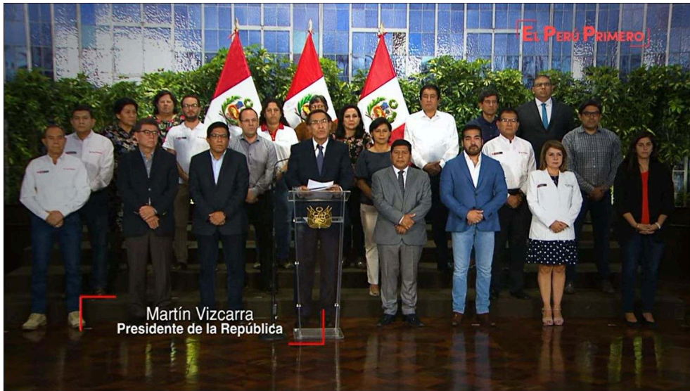
Illustration 2 - Le premier discours officiel « à la Nation » du Président péruvien du 15 mars 2020 : déclaration de l'état d'urgence