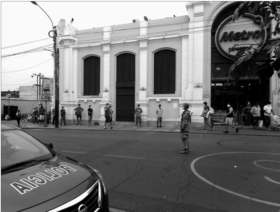
Illustration 4 - La police et l'armée contrôlent le respect de l'ordre dans l'espace public, face à l'entrée du supermarché Metro

Auteure : I. Valitutto, Quartier de Barranco, Lima, avril 2020.