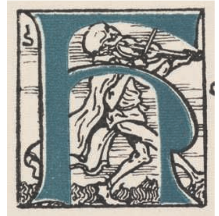
Lettrine de Joseph Sattler pour l'ornement, dans les Légendes d'Alsace de Georges Spetz, du Violon du diable au Donon (1905)