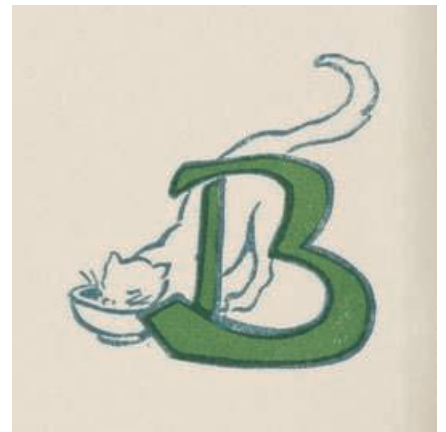
Lettrine de Victor Prouvé pour l'ornement, dans les Légendes d'Alsace de Georges Spetz, de La Chatte de Florimont (1910)