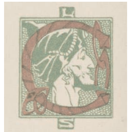
Lettrine de Léo Schnug pour l'ornement, dans les Légendes d'Alsace de Georges Spetz, du Diable au Hugstein (1910)