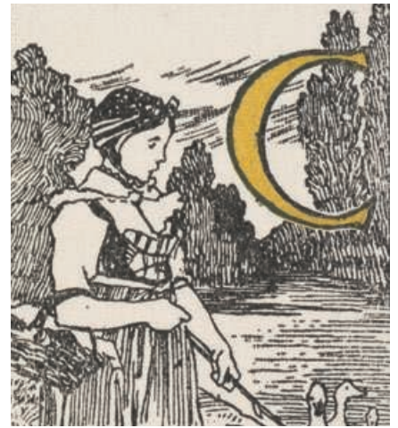
Lettrine de Charles Spindler pour l'ornement, dans les Légendes d'Alsace de Georges Spetz, de La Demoiselle blanche de la Fecht (1905)