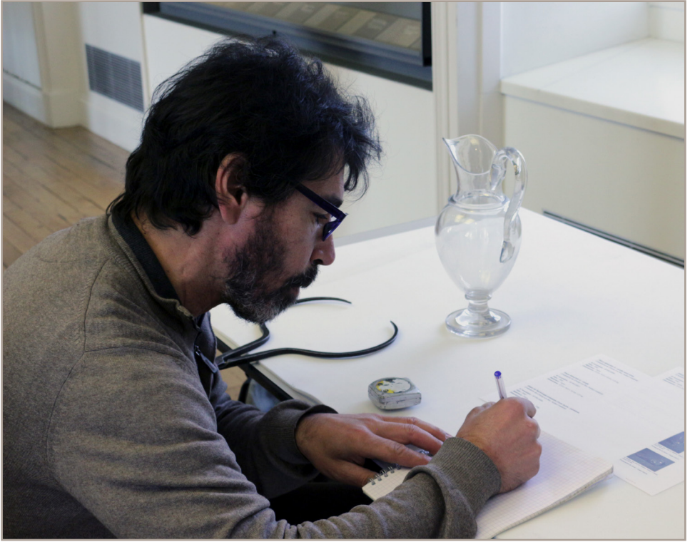
Figure 1 - Le verrier se familiarise avec la carafe dans le musée