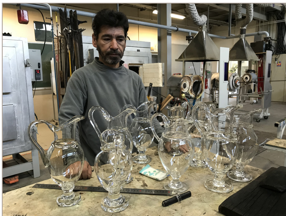
Figure 2 - Le résultat de la réplique de la carafe au Cerfav