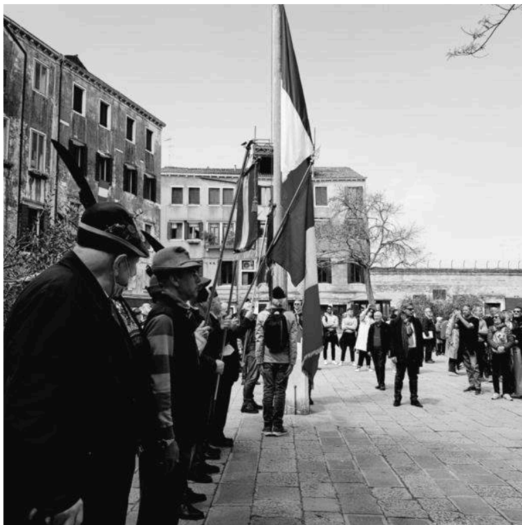
Figure 1. Clôture du défilé du parcours de la mémoire du 25 avril sur le campo ghetto nuovo , en présence entre autres de l'ANPI

Au premier plan, on voit les membres de l'association des Alpini 14 ; en arrière-fond, le mur commémoratif d'Arbit Blatas et le fil barbelé.