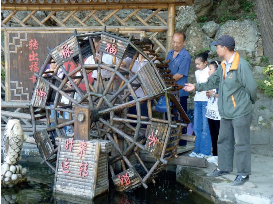
Fig. 2. « Roue de la fortune » ( zhuanyun tai 轉運台), Parc de Badachu, environs de Pékin, 2009. Photo : Stéphanie Homola.

L'analyse du « jouer » donne des fondements théoriques pour comprendre des pratiques très communes mais dont on ignore les mécanismes profonds, souvent balayés d'un « ce n'est qu'un jeu ». Comment expliquer que lancer une pièce dans une fontaine attire la chance ? Si les « superstitions » sont considérées comme des mécanismes d'adaptation en situation d'incertitude 14 , le « jouer » permet d'en expliquer les rouages concrets. R. Hamayon analyse ainsi comment les jeux ou rituels pour attirer la chance sont fondés sur l'aspect spatial et dynamique de la chance. Ce sont les mouvements dans l'espace et leur répétition dans le temps (des cartes qui sont battues, des pièces qui sont lancées) qui introduisent une latitude dans la réalisation de l'action. Le jeu (au sens d'espace défini facilitant le mouvement) que permet cette marge donne accès à l'indéterminé tout en offrant la possibilité de manipulation. Le frottement des doigts sur les mots, l'agitation des bâtons de divination avant le tirage, « animent » les objets, leur prêtant une agentivité dont un effet (la chance) est attendu 15 . La chance « naît du mouvement [...] et produit du mouvement (apparition de gibier, de pluie, apparition – métaphorique – de succès ou du bonheur) 16 ». En chinois, la chance ( yunqi 運氣) signifie littéralement « faire