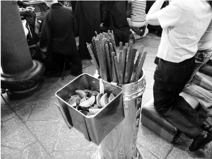
Fig. 4. Blocs et fiches divinatoires, Temple Longshan, Taipei, 2011.

Les exemples chinois montrent que la structure de la classification est déterminée par la forme et le nombre d'objets manipulés et par le type et le nombre de tirages effectués avec ces objets. Ces quatre éléments établissent le nombre total de combinaisons possibles – les figures mantiques – qui définissent un cadre de jeu strictement limité. Le cas le plus simple est celui du cadre classificateur binaire (oui/non ou positif/négatif) tel qu'il est construit par le lancer d'une pièce de monnaie dans un tirage « à pile ou face » : un unique lancer d'un unique objet à deux côtés distincts détermine deux possibilités.