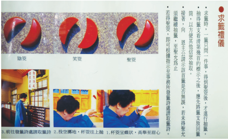
Fig. 3. Blocs divinatoires. De gauche à droite, réponses négative ( yinjiao 陰筊), indéterminée ( xiaojiao 笑筊) et positive ( shengjiao 聖筊), Temple Xingtian, Taipei, 2011.

générale du destin d'une personne, la cléromancie vise à répondre à une question particulière ou à évaluer une situation précise.