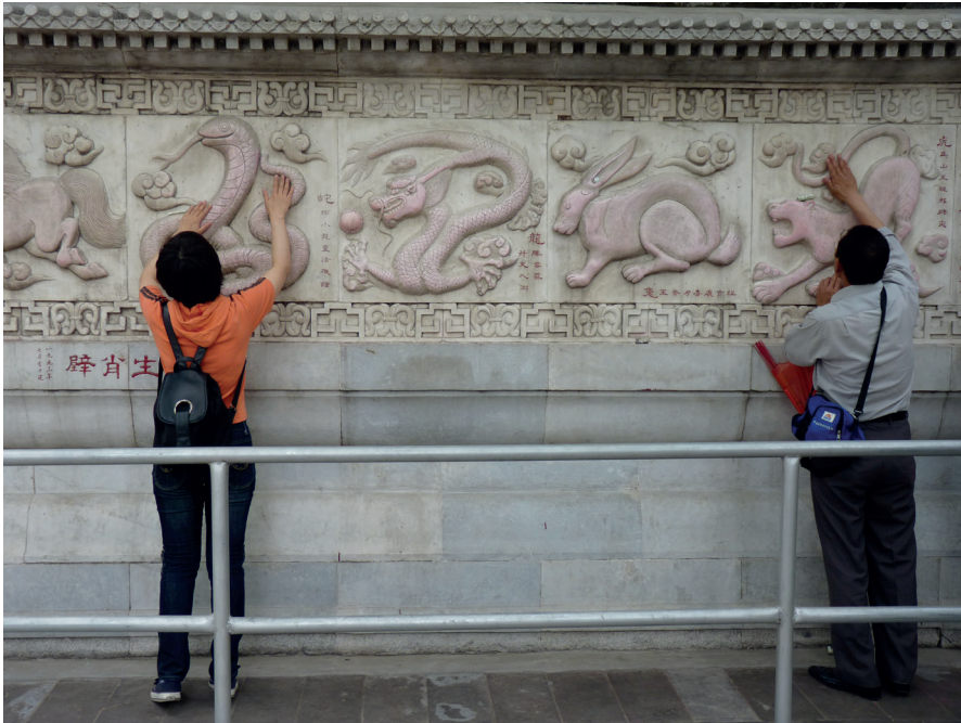
Fig. 1. « Mur des douze signes zodiacaux » ( shier shengxiao bi 十二生肖壁), Temple du nuage blanc, Pékin, 2010.

même, mais cette fois avec le soutien des autorités du temple, les visiteurs peuvent se promener le long du « mur des douze signes zodiacaux » ( shier shengxiao bi 十二生肖壁), en frottant leurs mains sur le signe correspondant à l'année en cours ou à leur année de naissance (fig. 1).