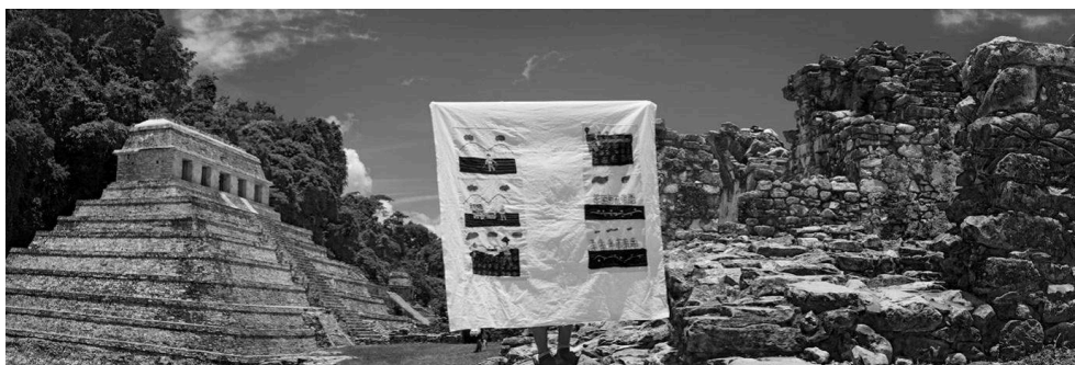
Figure 8 : Palenque, Chiapas, Mexique. 2011. Série Mujer, maíz y resistencia

Lorsque les Espagnols ont envahi les Mayas, les femmes ont eu la responsabilité de sauvegarder leur langue, leurs rituels et traditions. Les hommes sont partis travailler ou ont été enrôlés dans les armées. Malgré la misère, les femmes ont maintenu vivace la flamme d'une culture millénaire.