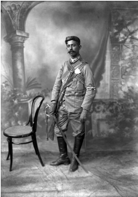
Figure 11 : Revolucionario . Mexique, 1914