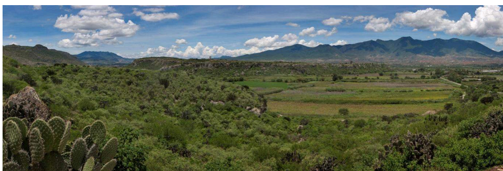
Figure 7 : Vallées centrales de Oaxaca, Mexique, 2011. Série Mujer, maíz y resistencia

Les premières traces d'agriculture en Amérique ont été trouvées au pied des grottes préhistoriques de Yagul et Mitla, dans les vallées de Tehuán et de Oaxaca. La domestication du maïs a commencé là-bas il y a environ 7000 ans, à partir d'une variété sauvage.