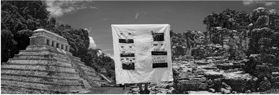
Figure 8 : Palenque, Chiapas, Mexique. 2011. Série Mujer, maíz y resistencia

Lorsque les Espagnols ont envahi les Mayas, les femmes ont eu la responsabilité de sauvegarder leur langue, leurs rituels et traditions. Les hommes sont partis travailler ou ont été enrôlés dans les armées. Malgré la misère, les femmes ont maintenu vivace la flamme d'une culture millénaire.