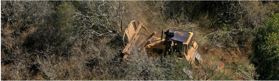
Figure 3 : Défrichements / Bulldozer en action. La Tigra, Chaco. 2006. Série Las madres del monte