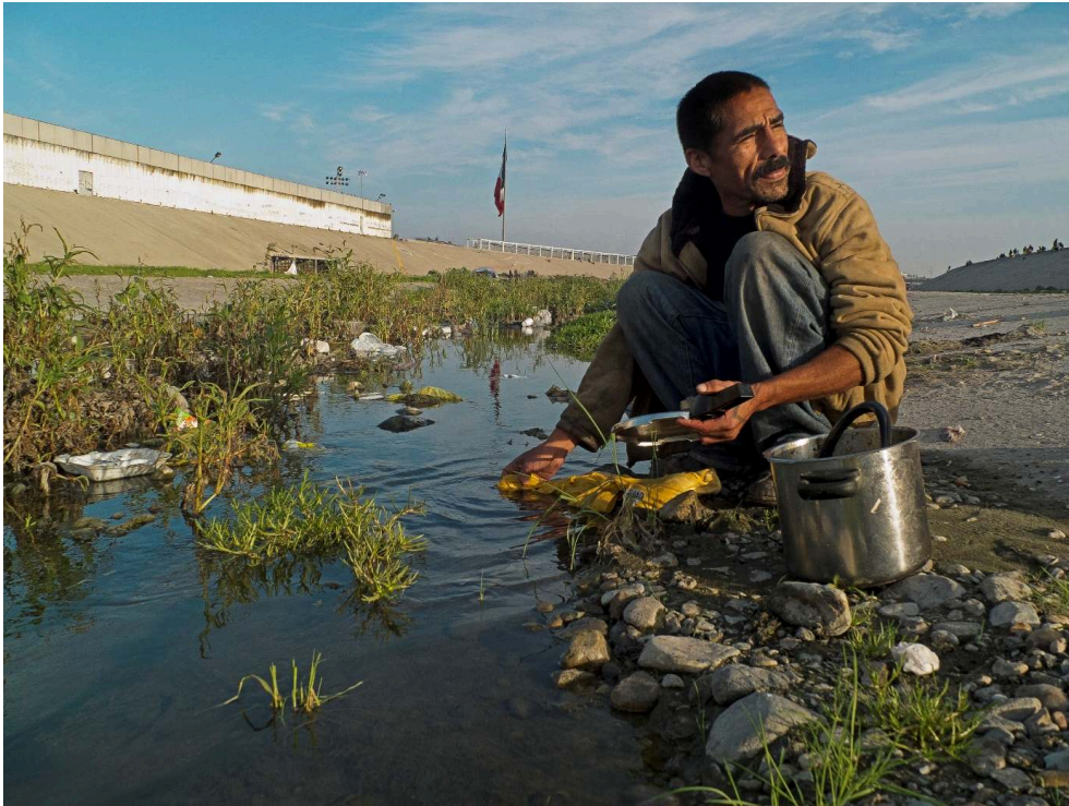
Image n°10 : Francisco Mata Rosas, Sans titre , Canalisation du fleuve Tijuana – zone Nord, 2013

Je pense qu'une énième photographie d'un migrant en train de sauter par-dessus le mur n'est pas nécessaire. Je pense qu'on n'en a pas besoin : beaucoup de gens ont fait, et bien fait, cette photo-là. Ce qui m'attire, c'est la culture populaire de ceux qui restent attrapés. [...] Je m'intéresse davantage à ceux qui ne peuvent pas y retourner mais ils ont toute l'information nécessaire, leurs saints, leurs croyances, leurs manières d'entrer sexuellement en relation 16 .