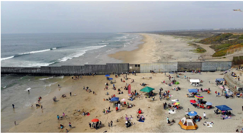
Image n°13 : Francisco Mata Rosas, Sans titre , Plage de Tijuana, 2018