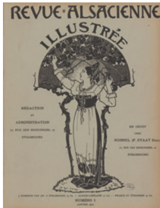
Charles Spindler, couverture de la Revue alsacienne illustrée , 1904

Mais c'est peut-être à travers les revues que s'exprime le plus amplement la problématique de la culture alsacienne que les artistes n'ont cessé d'inter-