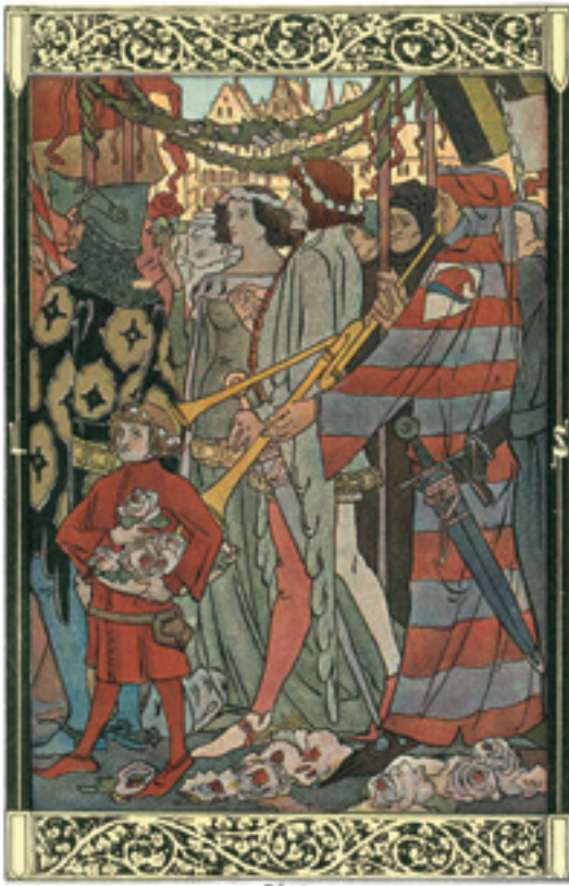
Léo Schnug, illustration pour « La peste de Guebwiller » de Georges Spetz dans les Légendes d'Alsace , 1905 (coll. BNU)