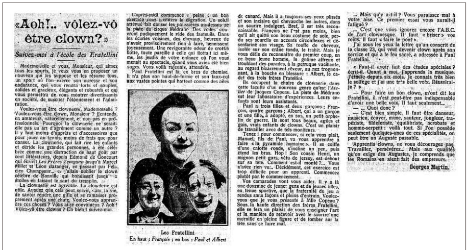
Figure 5. G. Martin, « "Aoh!... Vôlez-vô être clown ?". Suivez-moi à l'école des Fratellini », Le Petit Journal , 16 avril 1923, p. 1.