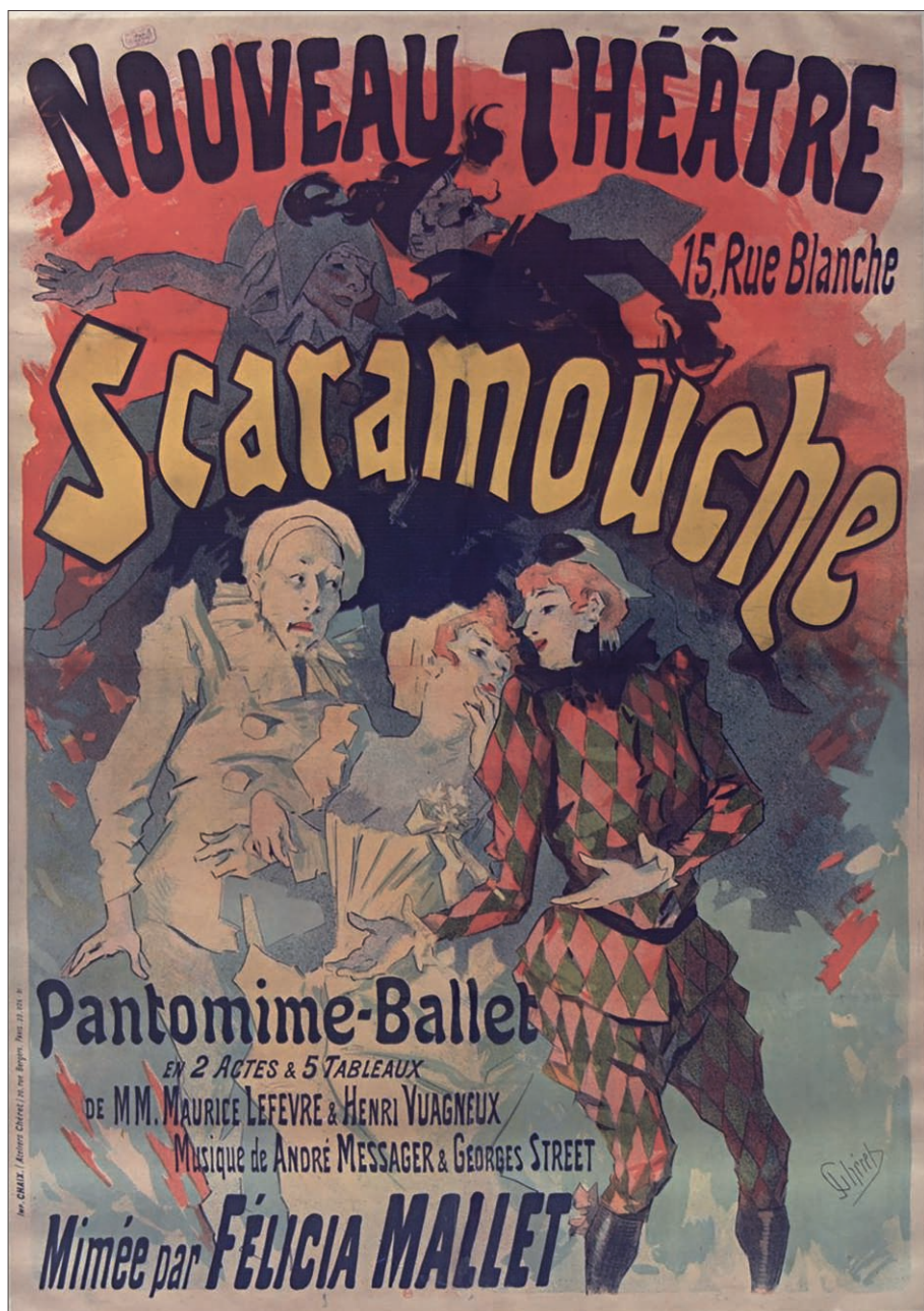
Figure 3. Jules Chéret, Scaramouche , affiche, 1891.