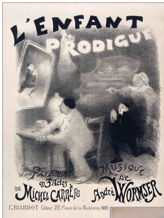
Figure 1. Adolphe Willette, L'Enfant prodigue , affiche, 1890.