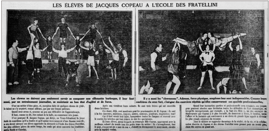
Figure 4. « Les élèves de Jacques Copeau à l'École des Fratellini », Le Quotidien , 10 juin 1923, p. 6, [non signé].