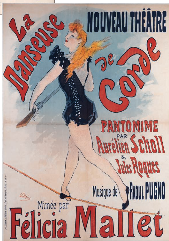
Figure 2. Jules Chéret, La Danseuse de cordes , affiche, 1892.