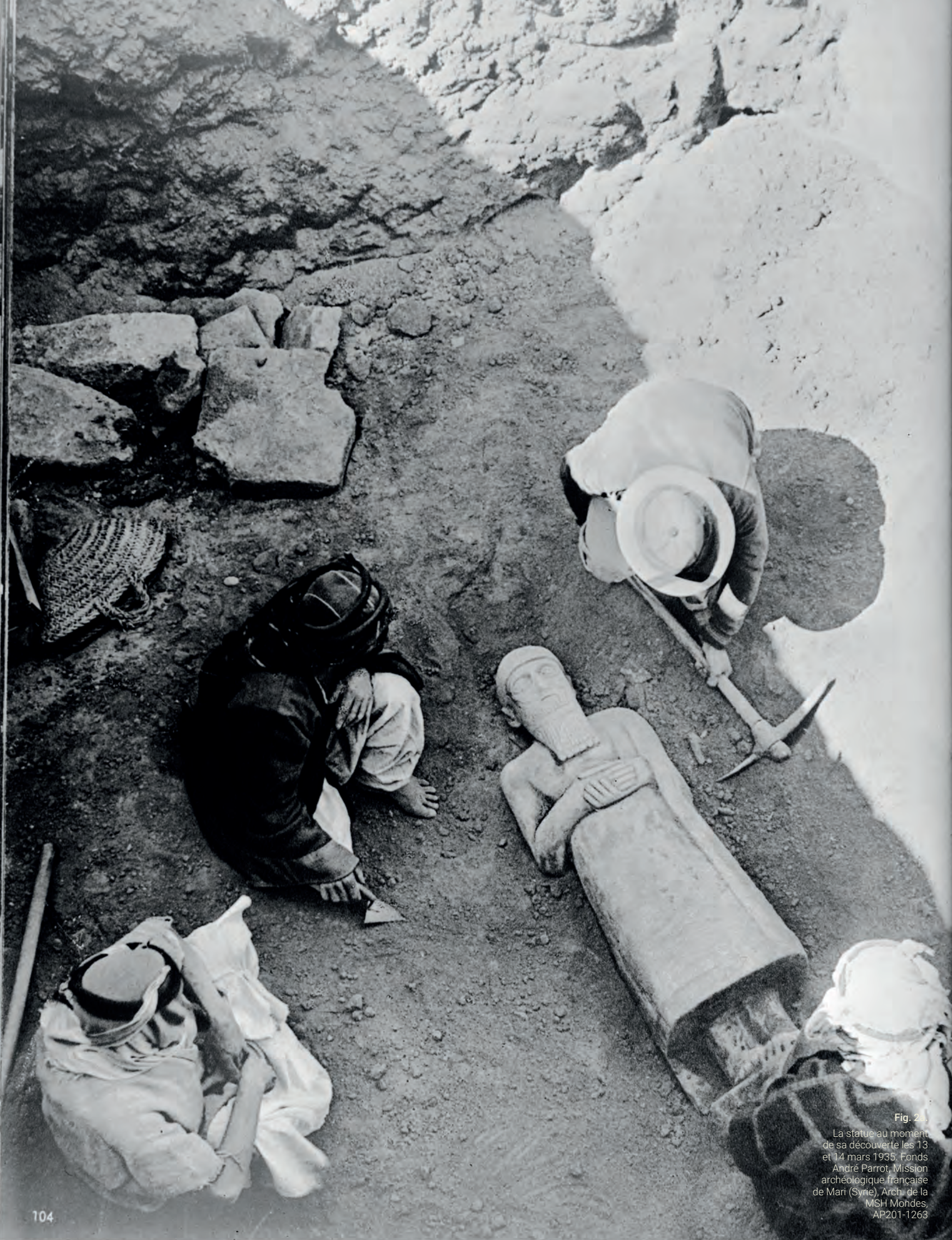
Fig. 24 La statue au moment de sa découverte les 13 et 14 mars 1935. Fonds André Parrot, Mission archéologique française de Mari (Syrie). Arch. de la MSH Mondes, AP201-1263