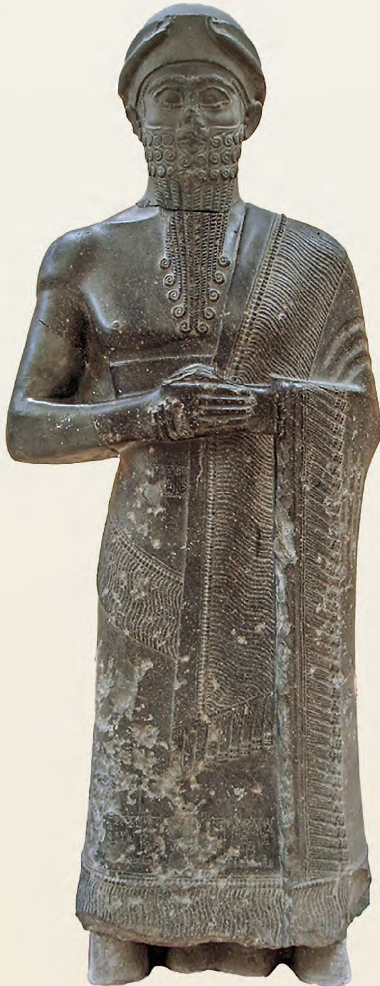
Fig. 7. Statue du Šakkanakku Puzur-Eštar Diorite, H. 193 cm Iraq, Babylone, Palais principal de Nauchodonosor II – originellement de Syrie, Mari, Grand palais royal Époque de la « Ville III », šakkanakku Règne de Puzur-Eštar (XX e s. av. J.-C.) Musée archéologique d'Istanbul (corps) et Vorderasiatisches Museum de Berlin (tête)