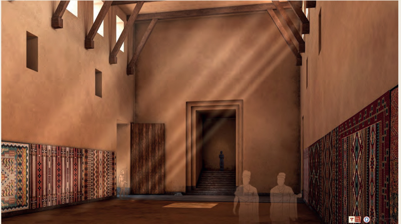
Fig. 4. Vue vers la tribune depuis la salle 65 du Grand palais royal. Modélisation en 3D