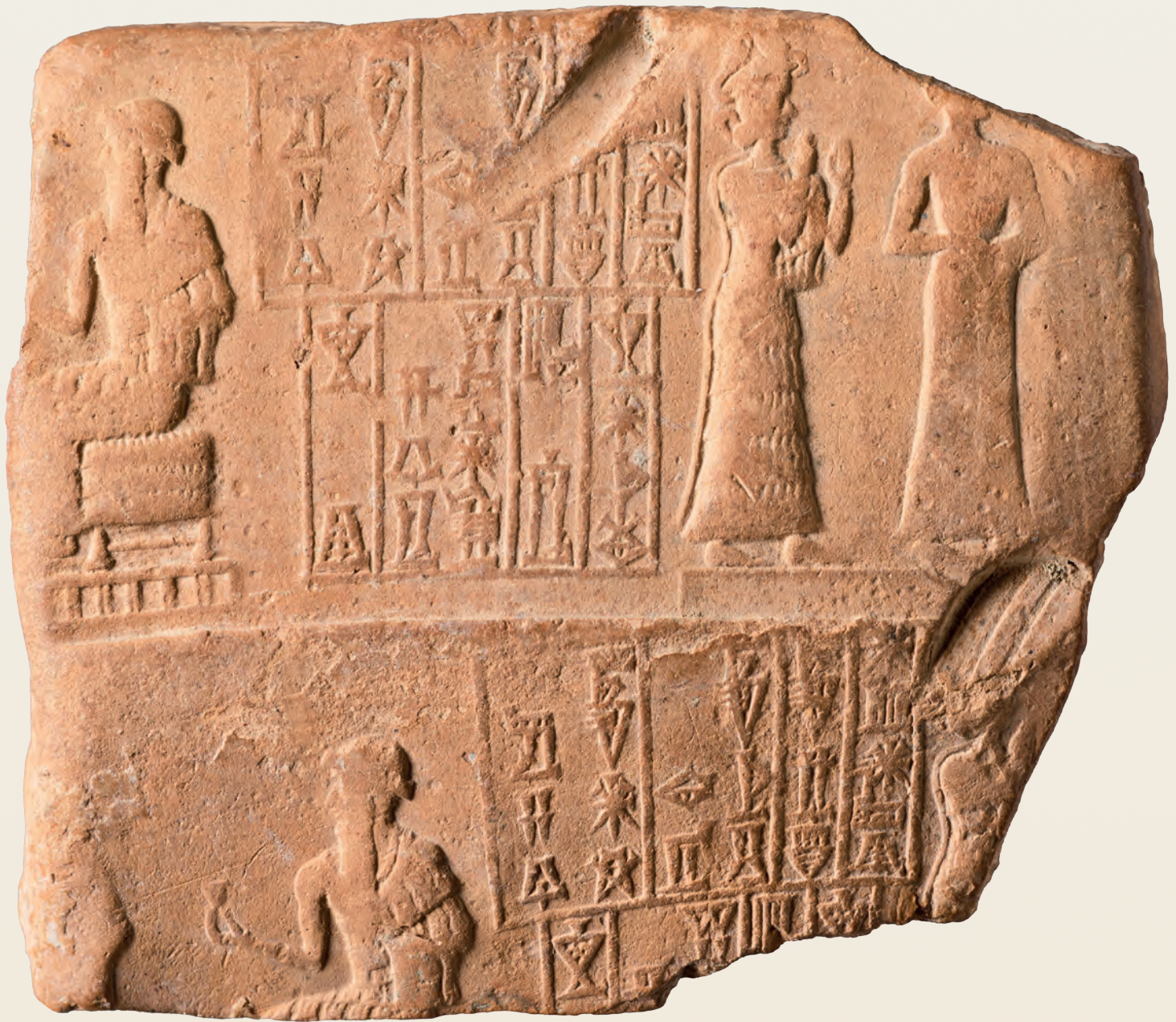
Fragment d'enveloppe de tablette portant l'empreinte d'un sceau du haut-fonctionnaire Arad-Nannar