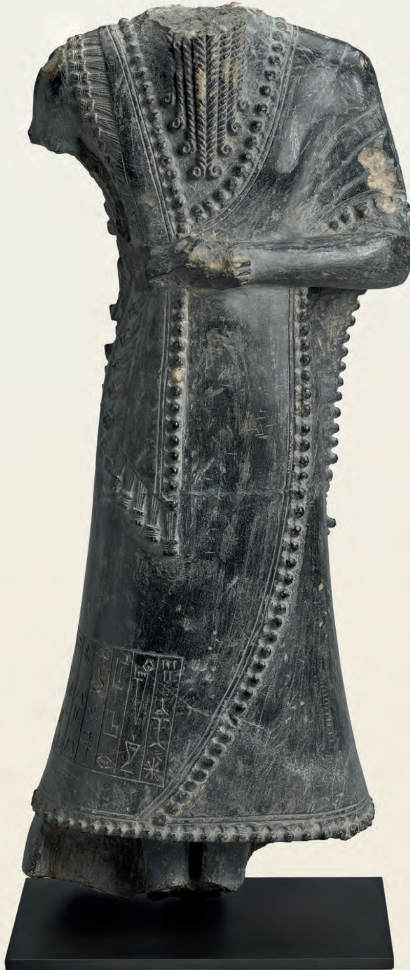
Fig. 6. Statue du Šakkanakku Iddin-ilum Stéatite, 41 x 16,5 x 11,5 cm Syrie, Mari, Grand palais royal cour 136 et cour 148 Époque de la « Ville III », šakkanakku Règne d'Iddin-ilum (début du XX e s. av. J.-C. ?) Louvre, DAO, AO 19486