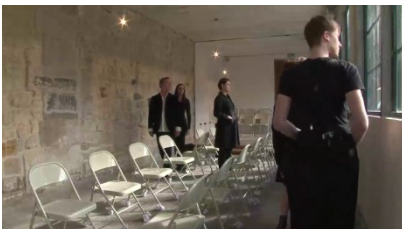
Fig.3. Filage, début de marche le long des vitres © Cie Emoi71, mai 2012.