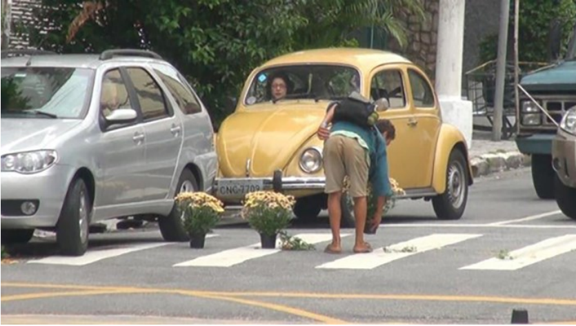
Image 1. Un citoyen inconnu recueille des pots de fleurs lors de l'intervention urbaine Bartira. São Paulo, Rua Bartira, 2013.

Dans la ville d'Uberlândia un des performeurs s'est attaché au poteau du feu rouge de la rue Duque de Caxias, avec les pieds enterrés dans un sac de terre, la bouche bâillonnée et une affiche sur laquelle se lisait : Pour quoi Duque de Caxias ? Pendant cela, d'autres performeurs donnaient des fleurs aux conducteurs, les invitant à réfléchir sur qui était le Duque de Caxias.