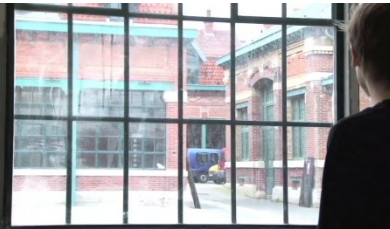
Fig.2. Vue des acteurs de l'intérieur de la serre © Cie Emoi71, février 2012.