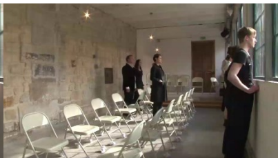
Fig.4. Filage, fin de marche le long des vitres © Cie Emoi71, mai 2012.

Comment, dans le récit du processus créatif pris en exemple dégager ce qui relève du processus de créativité ou d'apprentissage ? Quelle est