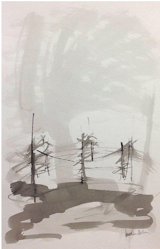
Imagem 1 – Just a hint of the Bridge. Fonte: Obra de Linda Donohue.

Universidade do Minho (UM), Braga – Portugal