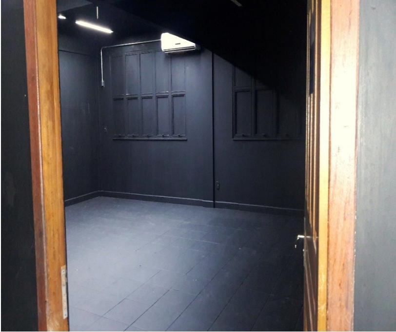
Imagem 1 – Laboratório Teatral /UFAC Rio Branco, Brasil, 2014.