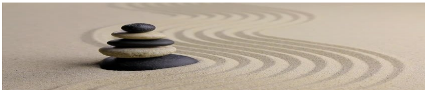
Imagem 9 – Sem título.

A intensidade de uma frase dá a educação dessa frase. Uma frase pouco intensa é uma frase mal-educada para o leitor. Porque? Porque não deves fazer uma pessoa perder tempo (Tavares, 2018, p. 46).