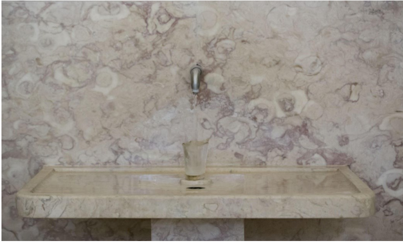
Imagem 6 – Fonte. Fonte: Virgílio Ferreira (2018).

quivo que, mais tarde, é tratado e usado pela artista quando desenha as suas próprias performances.