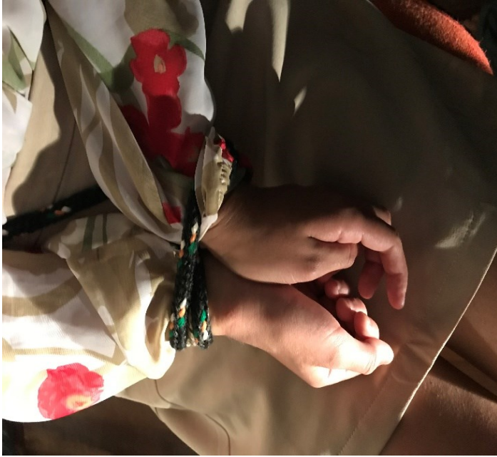
Imagem 5 – Jaqueline C. Ensaio-Investigativo Uma Lição Longe Demais no Laboratório Teatral /UFAC Rio Branco, Brasil, 2017.

Certamente, esse momento nos dava uma dimensão desse ‘Fazer Teatro’ e possibilitava um ensino dinâmico, estético, pedagógico, didático e investigativo. Mas era pela via dos ensaios-investigativos – a palavra ensaio é tomada aqui como uma ação de investigação, de planejamento, de estudo, de experimentação, de tentativas, de marcações, de invenções de aplicação e de avaliação entre os envolvidos –, conforme a Imagem 5, que nos conduzíamos para os ensinamentos dessa área de conhecimento, portanto, uma aventura teatral.