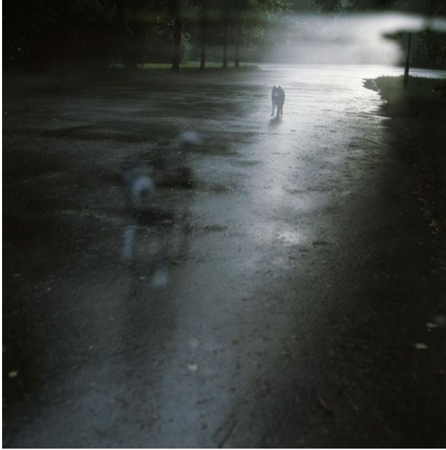
Imagem 5 – Uncanny Places.

Na minha última carta coloquei à tua consideração a ideia de convergirmos agora a discussão em torno do conceito de ENCONTRO, e suas dinâmicas, entendido enquanto experiência estética. Na tua resposta equacionas, antes de mais, o ponto de vista histórico. É bem verdade, como referes, que o conceito levanta inúmeros aspetos a considerar, não fosse ele um dos que estão na origem das especificidades das artes performativas. E, por isso mesmo, terá, ao longo do tempo, modos de leitura e de aplicação sempre diversos. Perante esse perspicaz comentário, decidi que o melhor que eu teria a fazer nesta nova carta seria chamar a jogo uma série de projetos artísticos que, de um modo ou de outro, reconhecemos ou vivenciámos em conjunto.