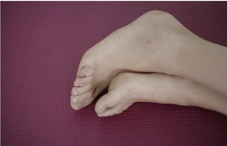
Imagem 2 – Procura d'apoios!.

Encontro-me neste preciso momento de férias nos Açores. Voltar à terra natal e onde vivi até ao fim da adolescência ativa-me sempre um conjunto de memórias. Sendo insular, lembro-me, por exemplo, de quando recebia CARTAS dos meus irmãos mais velhos, pois esse era o meio mais pessoal e íntimo que encontravam para partilhar as suas descobertas dessa Lisboa para onde tinham ido estudar. O imaginário da capital começou a desenhar-se por essa via!