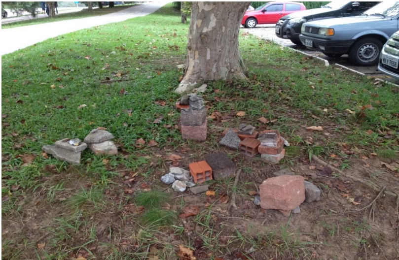
Imagem 1 – Pedras colhidas durante a experiência Caminho das Pedras , CAL, UFSM, 2018.

alguma dor que marcara sua vida. A ação ocorreu em diversos locais de Santa Maria, como o campus universitário, pontos de ônibus, centro da cidade, entre outros. Para cada dor contada, uma pedra era escolhida para dimensionar simbólica e fisicamente o peso, o tamanho, a temperatura, a textura e/ou a cor dessa dor. Muitas vezes não havia pedras disponíveis nos locais percorridos, portanto, os próprios integrantes do grupo colhiam as pedras um tempo depois do contato estabelecido de acordo com sua própria percepção da narrativa. As pedras nas sacolas foram carregadas como materialização concreta da dor durante todo o trajeto. Ao percorrer ruas interpelando transeuntes e carregando pedras durante uma tarde, os integrantes da ação retornaram ao laboratório quando não suportavam mais o peso das dores. Exaustos, todos colocaram suas pilhas de pedras no chão (Imagem 1) e, depois, sentaram-se em um círculo na grama, embaixo de uma árvore, em frente ao prédio do Centro de Artes e Letras da UFSM. Instaurou-se um momento de silêncio, de espera, até que todos chegassem para compartilhar as narrativas diversas na companhia daquela pilha de pedras no chão ao centro do círculo. Ficaram todos lá até escurecer. As pedras puderam ser tocadas durante esse compartilhamento. Também foi possível sentir seu peso, textura e os vestígios de sujeira grudados nelas.