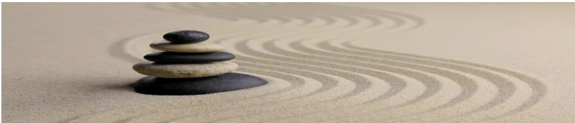
Imagem 9 – Sem título.

A intensidade de uma frase dá a educação dessa frase. Uma frase pouco intensa é uma frase mal-educada para o leitor. Porque? Porque não deves fazer uma pessoa perder tempo (Tavares, 2018, p. 46).