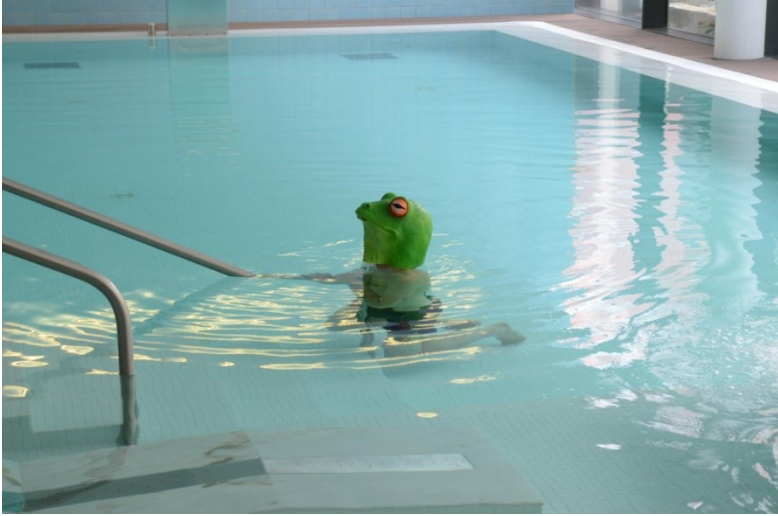
Imagem 7 – Aquistas.

Todo este percurso desembocava no espaço da piscina.