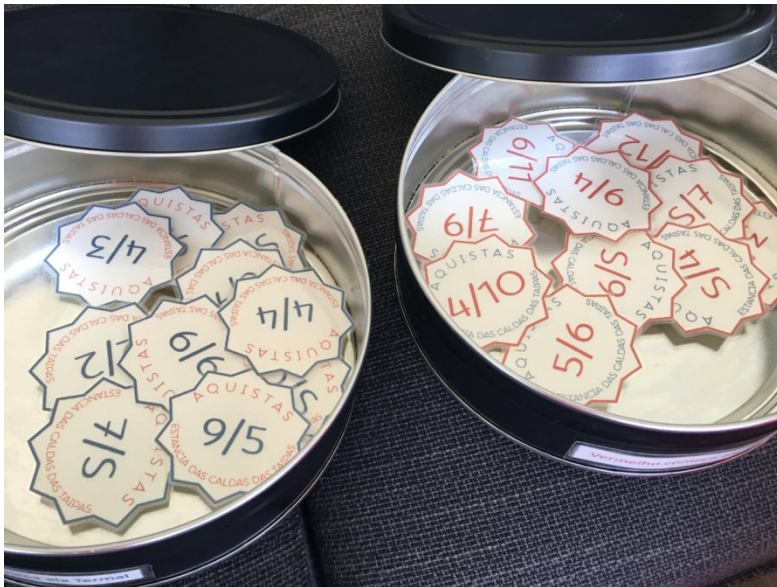
Imagem 8 – Probabilidade.