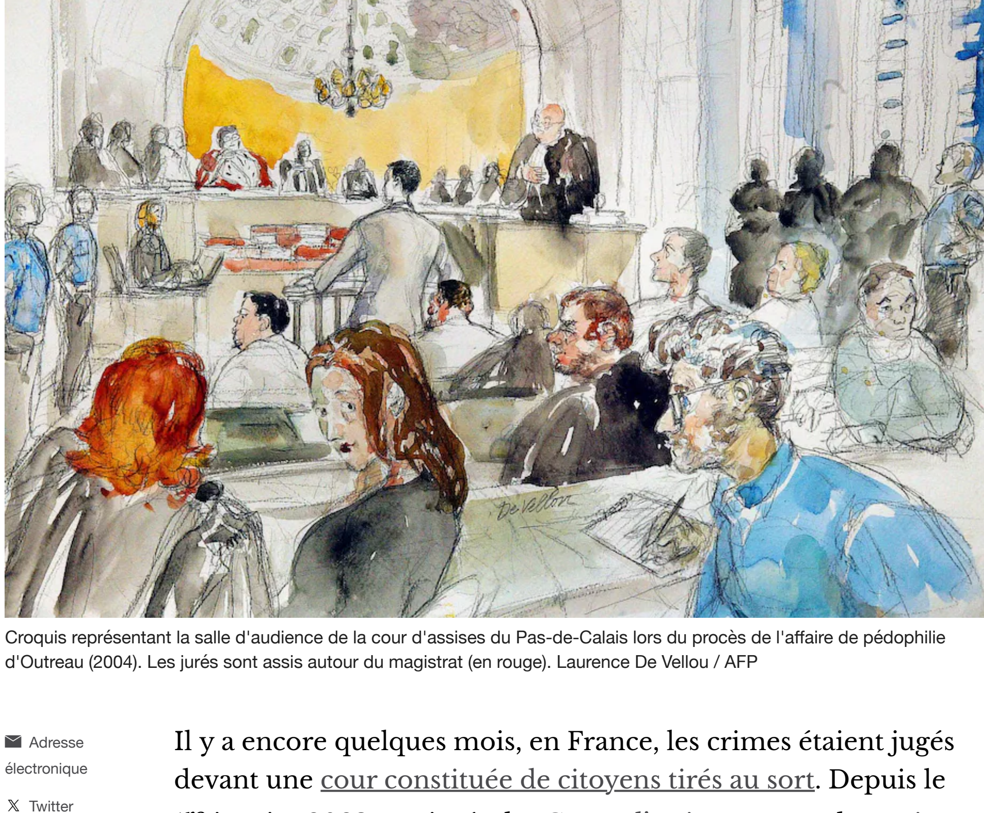
Croquis représentant la salle d'audience de la cour d'assises du Pas-de-Calais lors du procès de l'affaire de pédophilie d'Outreau (2004). Les jurés sont assis autour du magistrat (en rouge). Laurence De Vellou / AFP