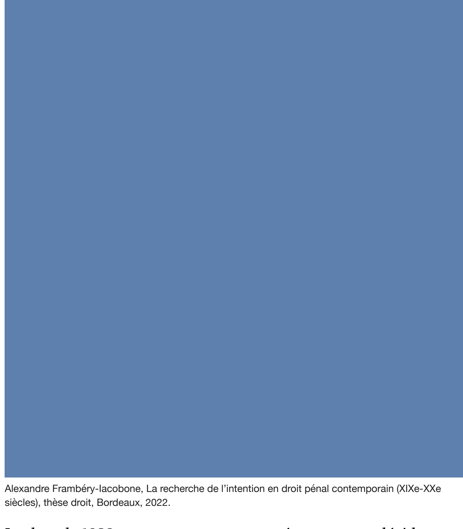
Alexandre Frambéry-lacabonne, La recherche de l'intention en droit pénal contemporain (XXe-XXIe siècles), thèse droit, Bordeaux, 2022.

Auparavant les jurés déterminaient l'infraction. Désormais, ils décident indirectement de la sanction, puisque ce sont les circonstances atténuantes ou aggravantes retenues qui déterminent en partie la pénalité. La situation est paradoxale : c'est en augmentant les pouvoirs de jurés honnis que le législateur les guide sur la voie de la sévérité.