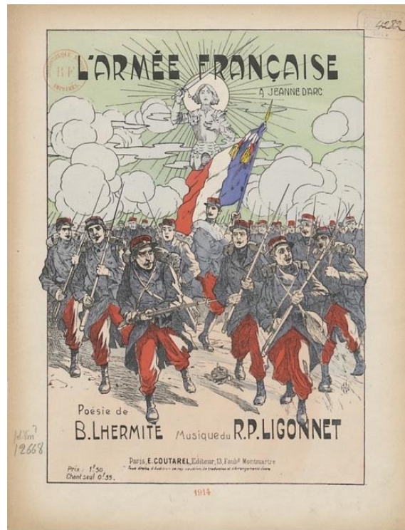
Fig. 3 Couverture du livret de la chanson, L'armée française : à Jeanne d'Arc et à la Vierge Marie , poésie de B. Lhermite, musique du R. P. Ligonnet, 1914 © Bibliothèque Nationale de France.

Jeanne apparaît encore dans les affiches et cartes postales pour condamner la destruction de la cathédrale de Reims en flamme, un patrimoine qui réunit l'ensemble des patriotes car il appartient aux historiens autant qu'aux croyants.