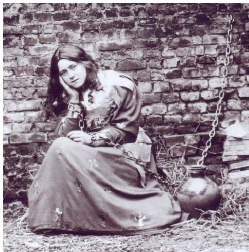
Fig. 1 Thérèse de Lisieux en Jeanne d'Arc enchaînée , 1890, Wikimedia. Domaine public 2 .