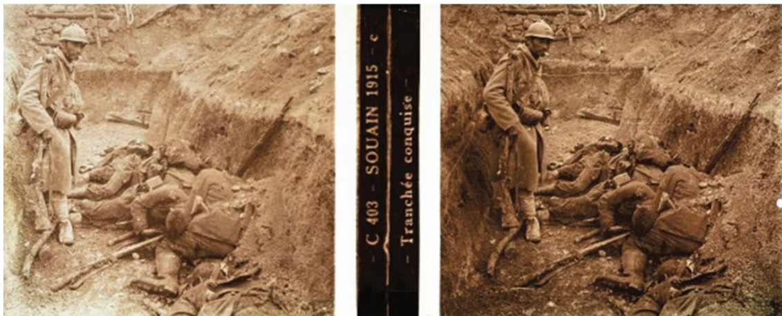
Fig. 2 Tranchée conquise , 1915, photographie stéréoscopique sur plaque de verre. Don de Gérard Bonnot. © Europeana

La valorisation du sacrifice de l'individu qui se fond dans le groupe, la célébration du mouton qui suit son chef, et les larmes des femmes, Duchamp les a en horreur. En 1915, lorsqu'à la litanie des appelés vient succéder celle des morts annoncées aux familles, Duchamp dit que la nouvelle devient presque banale et s'apparente à « un élément d'un vaste chagrin universel » plutôt qu'à l'indicible douleur de la mort d'un fils ou d'un père (Breuer, 12 sept. 1915, n. p.). Dans la mort de masse le disparu perd sa singularité, même pour les siens, une idée odieuse pour Duchamp. À l'instar de cette image prise par un soldat d'un autre, la cigarette à la bouche face aux ennemis morts dans une tranchée en 1915 (fig. 2). L'indifférence crâne, voire la satisfaction du vainqueur face à ces ennemis devenus masse animale, l'instauration d'un regard apathique, objectifiant l'autre et la mort, est l'épitomé de cette horreur.