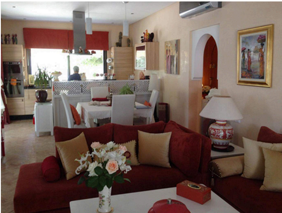
Illustration 4. Le séjour de Samia, Dyar Shemsi