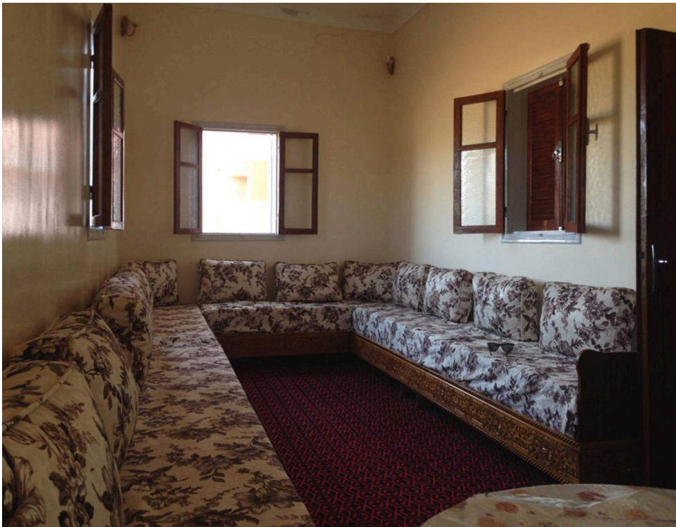
Illustration 2. Salon d'un retraité marocain, environs de Tiznit