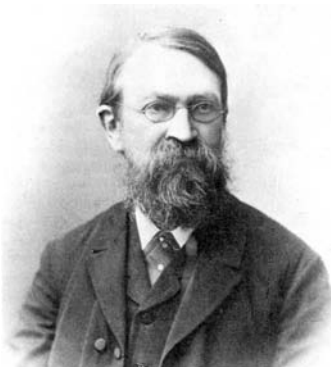
Ernst Mach (1838-1916)

i3-CRG, École polytechnique, CNRS, IP Paris