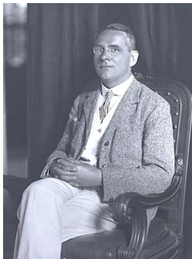
Ernst Mach (1882-1936)

En 1920, tout a changé. Vienne a perdu de sa superbe, l'Empire a disparu, laissant un État complètement déséquilibré avec une ville énorme au milieu d'un pays rural. Vienne – fait inimaginable quelques années auparavant – a connu la famine lors de la troisième année de guerre. Les épidémies ont décimé la population : Klimt, Egon Schiele, l'architecte Otto Wagner, sont morts de la grippe espagnole avec beaucoup d'autres. Hans Hahn, après avoir été professeur à Bonn, y revient en 1921 pour occuper la chaire de physique. Hahn est surtout un mathématicien, célèbre pour plusieurs théorèmes importants. La même année, Einstein est à Vienne pour une série de conférences qui attirent des milliers de personnes (l'Université n'ayant pas de salle assez grande, c'est au Musikverein qu'elles auront lieu). On cherche alors un professeur de philosophie pour remplacer Boltzmann et Einstein recommande Moritz Schlick. Ce dernier a étudié la physique à Berlin, mais, comme il l'a dit plus tard, il s'était :