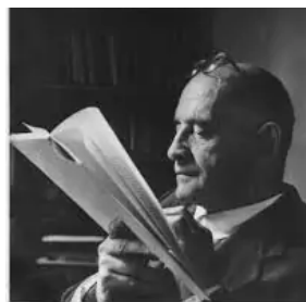
Leo Perutz (1882-1957)

C'est l'épithète du Cercle de Vienne, et d'une certaine Vienne. Lorsque Gödel avait réussi à rejoindre les États-Unis et qu'on l'avait interrogé sur la situation dans la capitale autrichienne, il avait répondu : « Le café y est infect. » Quand on connaît l'importance de cette boisson et celle des établissements qui le servaient dans l'histoire intellectuelle de Vienne, la remarque valait, elle aussi, épithète pour toute une époque ■