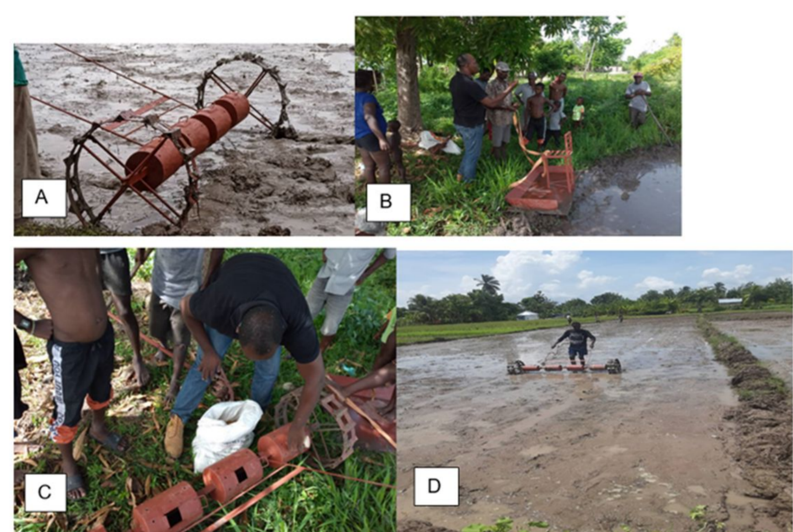
Semoir philippin en plein champs (A), planeuse (B), Remplissage des tambours du semoir par des semences prégermées (C), Semis mécanique avec semoir philippin en plein champ (D)