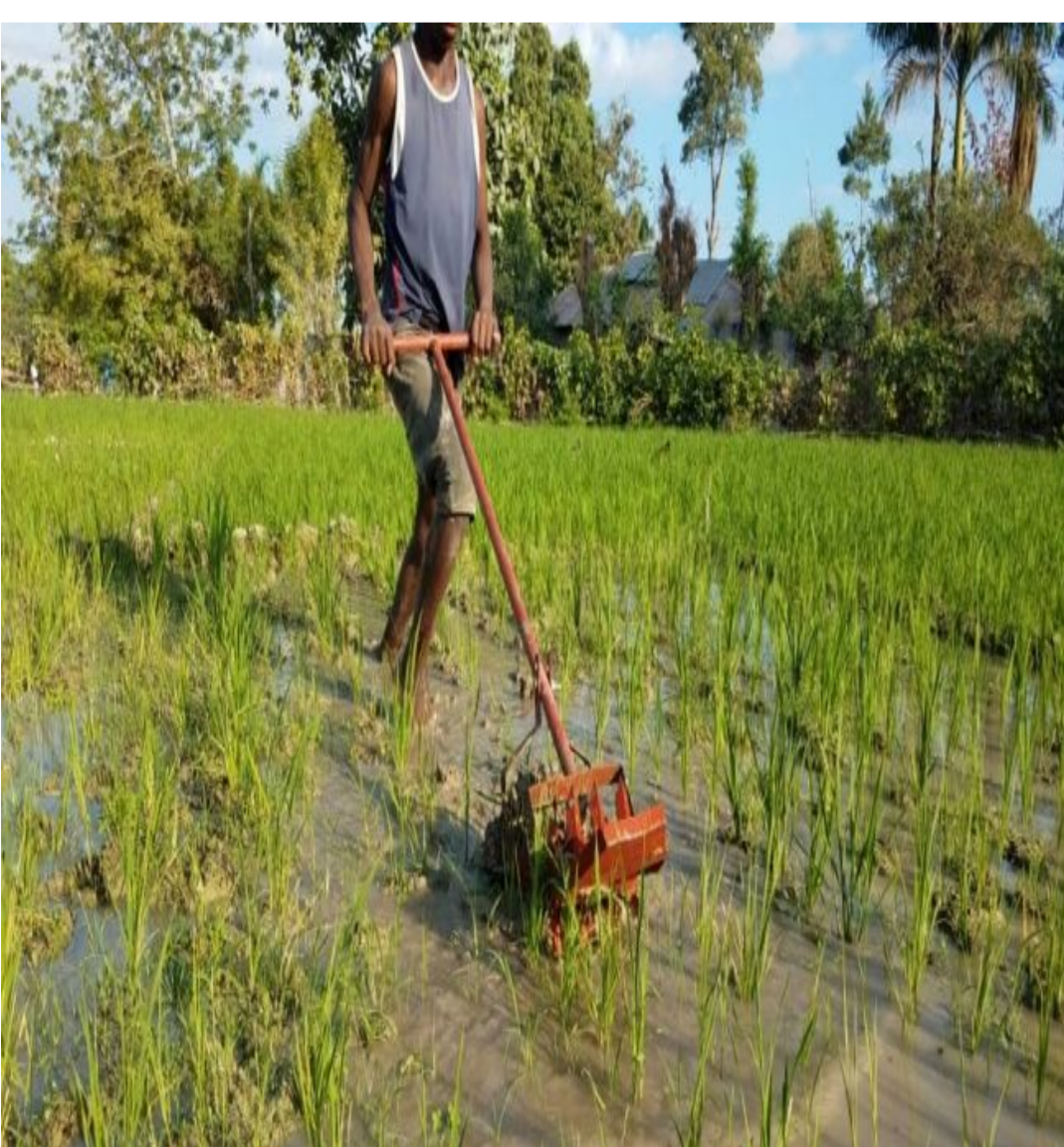
Sarcluse en plein champ