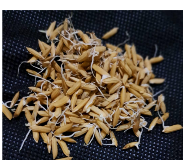
Prégermination trop avancée