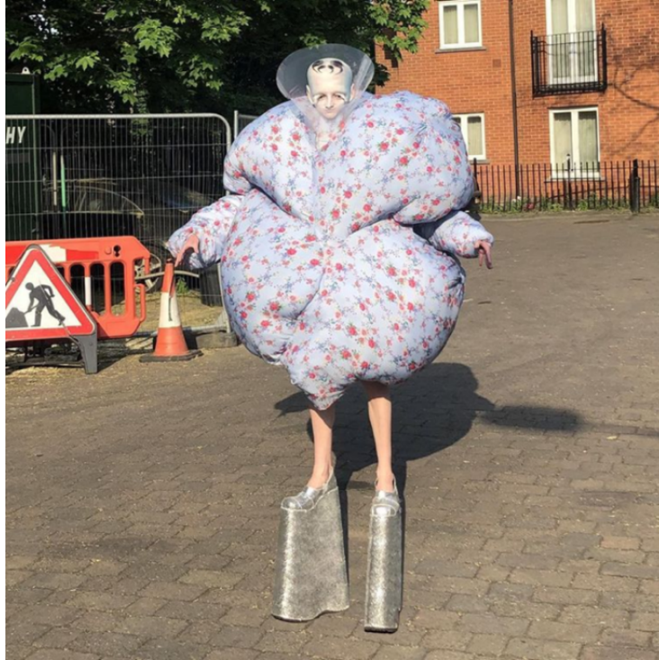
Spook. @_spook_ sur Instagram.

La table-ronde s'est enfin conclue par une courte (par manque de temps) présentation de l'ARQ : https://arqueer.hypotheses.org/comment-nous-rejoindre Pour voir le programme du congrès « Rotondes » : https://www.inha.fr/fr/actualites/actualites-de-l-inha/en-2021/rotondes.html