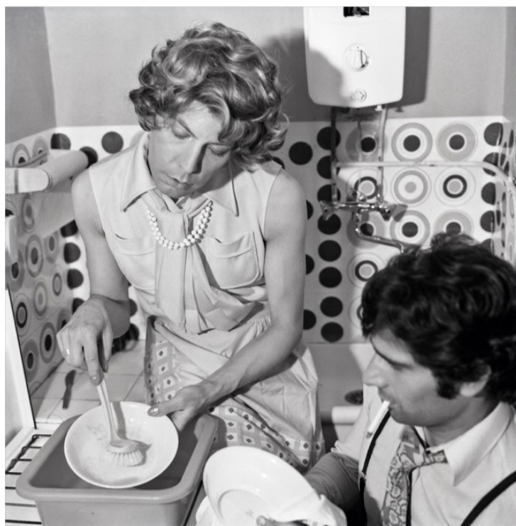
Michel Journiac, 24 heures de la vie d'une femme ordinaire , 1974

La dernière partie de la table-ronde a constitué une analyse d'œuvres en commun, une réalisée par un artiste institutionnel (Michel Journiac) et l'autre par un artiste alternatif (Spook). Il s'agissait de rapprocher les images à des principes théoriques issus des études queer .