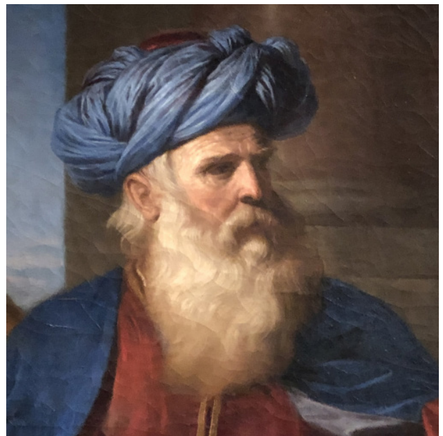
Abraham répudiant Agar, Le Guerchin, Pinacothèque, Milan 3 septembre 2022

On passe d'une idée à une action, d'une idée à une idée, sans cesse. La question est celle de la « raison des séries » ( op. cit. , p. 103).