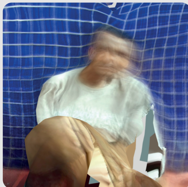
Fig. 3 : Photogrammétrise prise à São Paulo en 2023. Jordan Fraser Emery

Anton Giulio et Arturo Bragaglia. Comme le note Pauline Martin, ces deux futuristes indépendants n'ont que faire de l'approche analytique du mouvement défait de toute confusion proposé par Marey 8 , ils s'intéressent eux à la continuité du mouvement. Ainsi retrouvons-nous par exemple l'effet du flou de bougé dans Change of Position (1911) 9 et également dans le portrait qu'ils font d'Umberto Boccioni (1912-1913) 10 . Ce portrait futuriste qu'ils nomment de polyphysiognomique ( polifisiognomico ) voit les oreilles, le nez et les yeux recombinaés en parties fragmentaires du visage.