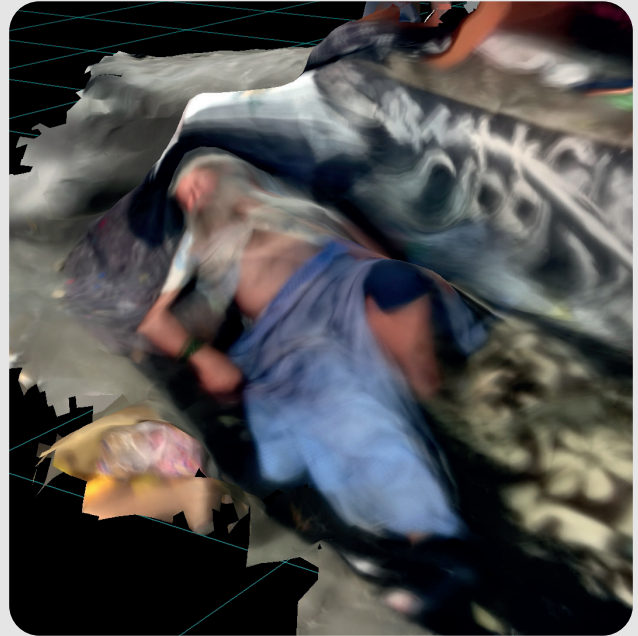
Fig. 4 : Photogrammétré prise à São Paulo en 2023. Jordan Fraser Emery

le corps de ceux qui malgré eux habitent (encore) l'espace public que s'expose cette expérience sensible.