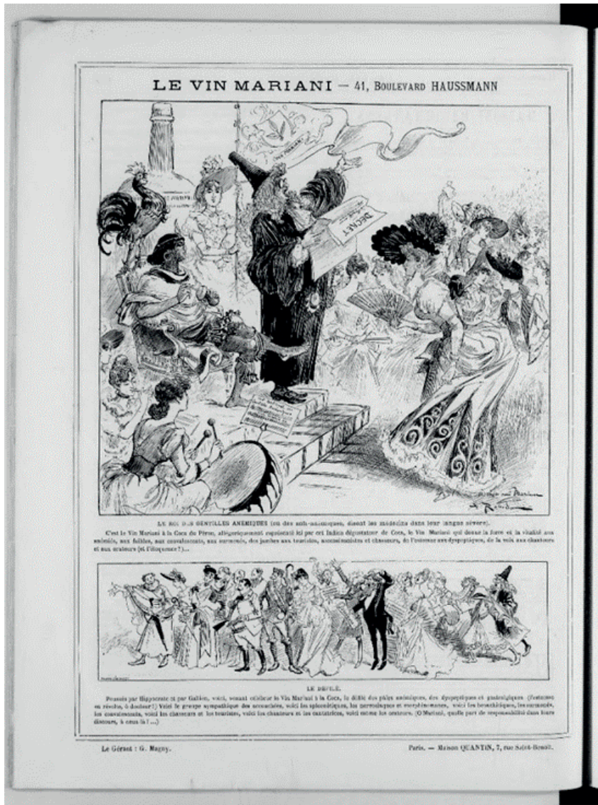
Ilustración 2: Albert Robida, “Le roi des gentilles anémiques”, La Vie parisienne , 10 de noviembre de 1888.

del afiche, en una divinidad inca: “Deidad inca negando la coca a su pueblo”. La propuesta de Mucha (1897) no solo insiste en el carácter divino de la coca y de la bebida que la diosa tiene en su mano derecha, sino que pretende alejar la bebida de la práctica cotidiana del pueblo, es decir, de los indígenas de acuerdo a las coordenadas ideológico culturales europea de entresiglos. A pesar de que la coca es una planta sagrada concebida como tal y utilizada