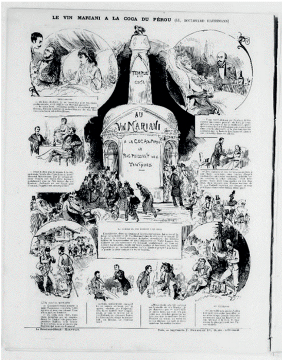
Ilustración 1: Albert Robida, “El templo de la coca”, La Vie Parisienne , 31 de marzo de 1877.

imágenes acerca de los beneficios del vino con hojas de coca.