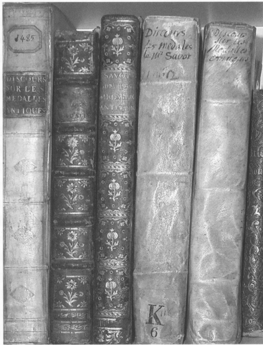
Fig. 2: Cinq exemplaires en diverses reliures anciennes.

et Savot était un homme de grande érudition» 20 , et Labbé qualifiait l'ouvrage de «travail érudit». De façon assez étonnante, la correspondance du peintre Rubens, grand amateur et épistolier fécond, ne conserve aucune lettre de ni à Savot, et ce dernier n'est pas non plus évoqué 21 . En effet, l'ouvrage de Savot ne semble pas avoir été un grand sujet de discussion ou de correspondance, pas même dans les milieux érudits et numismates: ainsi Peiresc semble n'en avoir parlé dans sa correspondance qu'avec les frères Dupuy, qui le lui avaient envoyé.