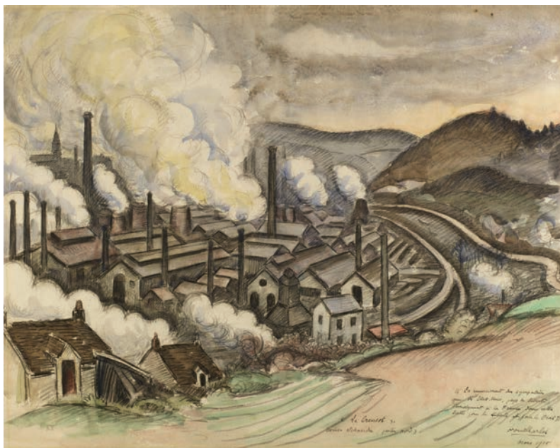
Figure 7 — Charlot (Louis), Le Creusot. Usines Schneider (partie Nord) , 1915, huile sur toile, 47,0 x 58,4 cm (Washington, Smithsonian Art Museum).

du créateur 1 ». Dans les années 1870, les effets stupéfiants de l'atmosphère produits par les fumées ont séduit et attiré l'attention de nombreux peintres impressionnistes. Claude Monet visita Londres à trois reprises, entre 1899 et 1901, afin d'y trouver des effets éphémères du brouillard et des fumées urbaines. Au Creusot, bien que l'ampleur du paysage et l'attrait pour le paysage enfumé de la ville industrielle en guerre soient différents, Louis Charlot, peintre des paysages et des hommes du Morvan, qui doit durant la guerre réaliser des dessins et des peintures patriotiques, focalise en 1915 son regard sur les effets de fumées. Dans son tableau Le Creusot. Usines Schneider (partie nord) , l'artiste magnifie les fumées des usines creusotines. Il peint la Plaine-des-Riaux, et son intense activité à travers les tourbillons de fumées. Les teintes utilisées pour les panaches de fumée sont essentiellement blanches, jaunes et légèrement gris-bleuté ; elles contrastent avec les couleurs plus sombres des usines, au creux de la plaine, tout comme celle des collines alentour et même du ciel. Loin de peindre des fumées menaçantes, Louis Charlot offre plutôt une vue esthétique de ce paysage industriel en pleine activité.