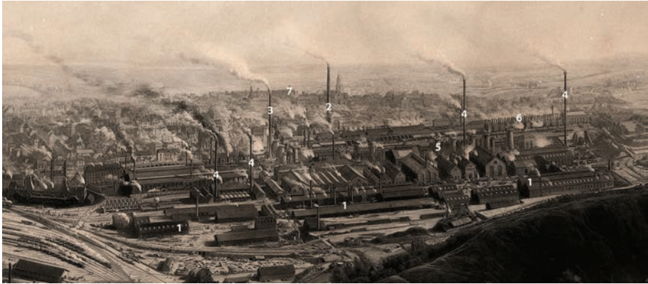
Figure 2 — Gambey (André), Le Creusot vue d'ensemble , 1873, gravure. ([scan. D. Busseuil] – Fonds Ecomusée Creusot-Montceau, 2572-5) © CUCM.

En 1873, Le Creusot est devenu un site industriel en pleine expansion. Dès 1860, l'usine développe un ensemble d'ateliers et halles (1) (halles de laminage, halles de puddlage, ateliers d'entretien, etc.). Ces ensembles entièrement métalliques s'associent à ceux en brique de 1850. On peut voir quelques cheminées industrielles, comme la Grande Cheminée en brique (2) et la cheminée des hauts-fourneaux (3), ainsi que d'autres cheminées métalliques non identifiées (4). Derrière les hauts-fourneaux (5) apparaissent les fours Appolt (6) qui crachent leurs fumées en direction de la ville. Enfin, sur le document apparaît au loin caché par les fumées et le brouillard, le château de la Verrerie (7), résidence locale des maîtres de forges. Cette représentation ne montre pas la Grande Forge (ou forge à laminoirs) et la Grosse Forge, qui sont situées dans la partie est du site industriel du Creusot.