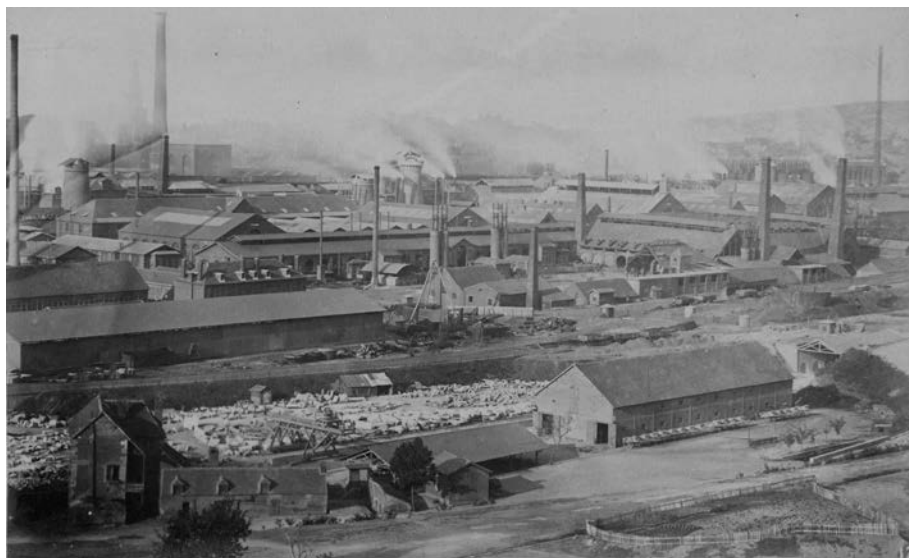
Figure 4 — Vue de la Plaine-des-Riaux, vers 1870-1880.

Cette photographie de la Plaine-des-Riaux montre la multiplicité des équipements sidérurgiques utilisés au Creusot : les fours Appolt, pour produire du coke, les hauts-fourneaux, pour former de la fonte, etc. Au premier plan, nous pouvons voir les bâtiments industriels et des cheminées inactives. L'arrière-plan témoigne de l'ampleur des pollutions au Creusot, caractérisé par une épaisse brume de fumée qui voile l'horizon. Le vent du nord pousse les fumées en direction des quartiers d'habitations et vers le clocher de l'église.