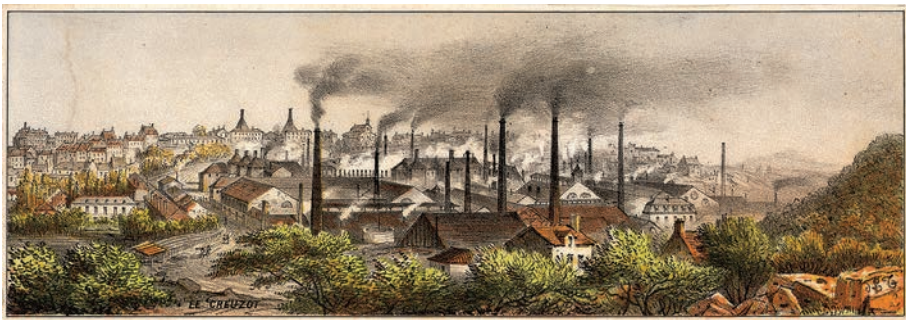
Figure 1 — Le Creusot, Plaine-des-Riaux : vue d'ensemble de la ville et des usines, 1850, lithographie.

Sur une lithographie datée de 1850 ( cf. ci-dessous), on voit ainsi une vingtaine de cheminées en brique regroupées dans la Plaine-des-Riaux. Vers 1873, la gravure d'André Gambey, fait apparaître des cheminées plus nombreuses et bien plus hautes, ce qui témoigne d'une industrie en plein essor. Les cheminées du Creusot impressionnent. Par leur hauteur, par les matériaux utilisés – de plus en plus le métal 3 – et par leur nombre croissant, elles deviennent les marqueurs d'un paysage industriel en pleine prospérité.