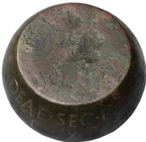
Figure 7 – Poids (© RMN-Grand Palais, musée du Louvre/Hervé Lewandowski ; Louvre, inv. n° BR 3413)