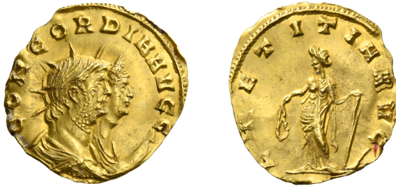
Figure 1 (© Numismatica Ars Classica ; × 2).

« Gallienus Valeriani Filius. R. 1. CONCORDIA AVGG. Capita Gallieni, eiusque Vxoris. Illud Gallieni radiatum. LAETITIA AVG. Figura stans, dextra Coronam, sinistra Timonem. A. C. 254. Quinariarius. Hic nummus rarissimus est et ineditus » 3 .