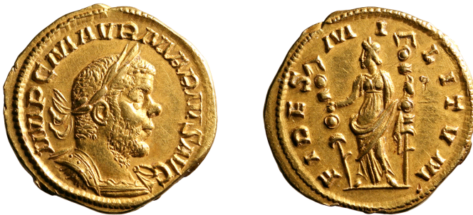
Figure 3 – Aureus de Marius (© BnF ; cliché : Jérôme Mairat, avec mes remerciements ; DMMA de la BnF inv. FG 1438 ; 5,61 g, 20 mm ; × 2).