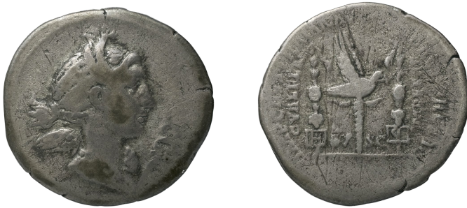
Figure 6 – Denier (© BnF, inv. IMP-3034 / BN495 ; 3,16 g, 20 mm ; acheté à Rollin & Feuardent le 6 février 1872 [de la collection Wigan ?] ; × 2).

Ma recherche sera grandement facilitée par l'existence de deux exemplaires annotés du catalogue : chaque auteur, l'abbé Charles-Philippe Campion de Tersan (1736-1819) et Pascal-François-Joseph Gosselin (1751-1830), a laissé un catalogue avec les prix réalisés et le nom des acheteurs. Celui de l'abbé est conservé à la BnF 23 , et celui de Gosselin dans une collection privée.