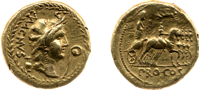
Figure 2 – Aureus de Pompée le Grand (inv. 1867,0101.584 ; 8,94 g, 21 mm ; × 2).

Certes, il n'est jamais parvenu à acquérir les trois monnaies qu'il désirait du cabinet Trivulzio, mais sa collection n'est pas moins remarquable : citons par exemple un aureus de Pompée le Grand 11 (connu aujourd'hui à 4 exemplaires) (figure 2), un aureus de Ahenobarbus au temple de Neptune 12 (connu aujourd'hui à 12 exemplaires), et un aureus de Marius 13 (unique) (figure 3). Et pour ne pas se limiter à l'or, citons aussi deux (!) deniers des Ides de Mars 14 , un denier de C. Antonius 15 (connu aujourd'hui à 4 exemplaires), l'un des 19 aes de Nîmes au « pied de sanglier » connus 16 , et encore un authentique coin monétaire de Néron (figure 4) 17 .