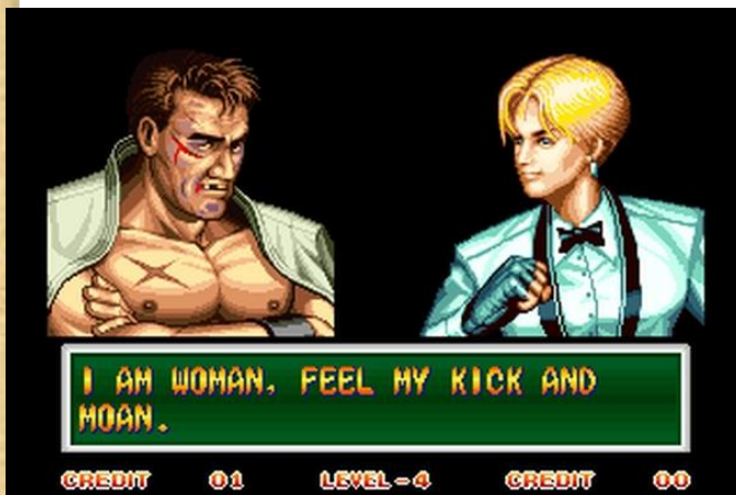
Art of Fighting (1993, Arcade)