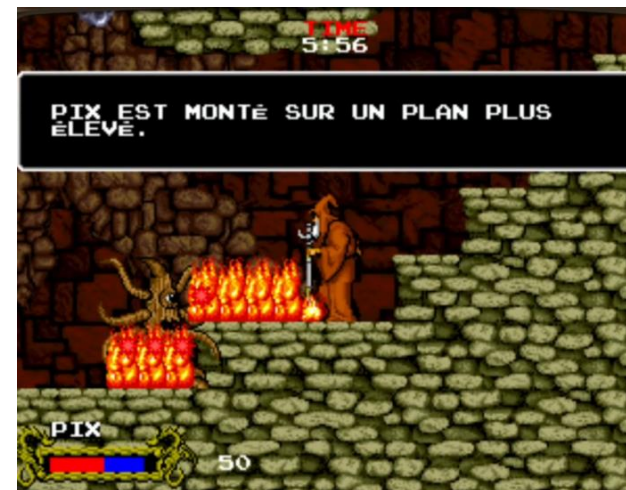
Cadash (1989, Arcade)