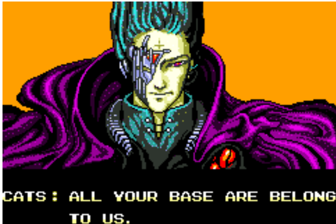
Zero Wing (1991, Megadrive)