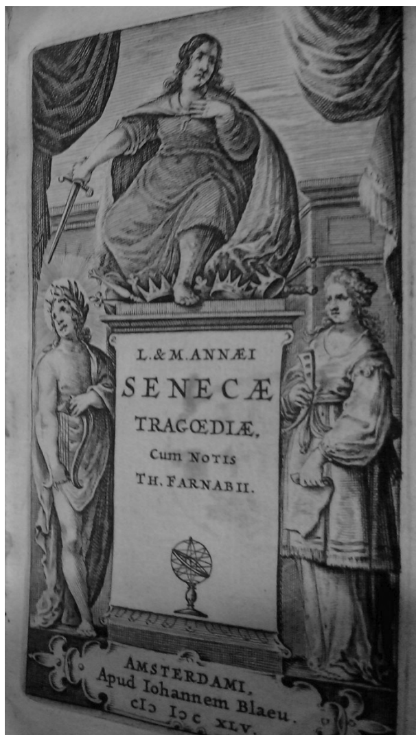
Figure 1. T. Farnaby, L. & M. Annaei Senecae Tragoediae , par Joan Blaeu, Amsterdam, 1645, page de titre, BU Arsenal, Université Toulouse 1 Capitole, Res Mn 8931.