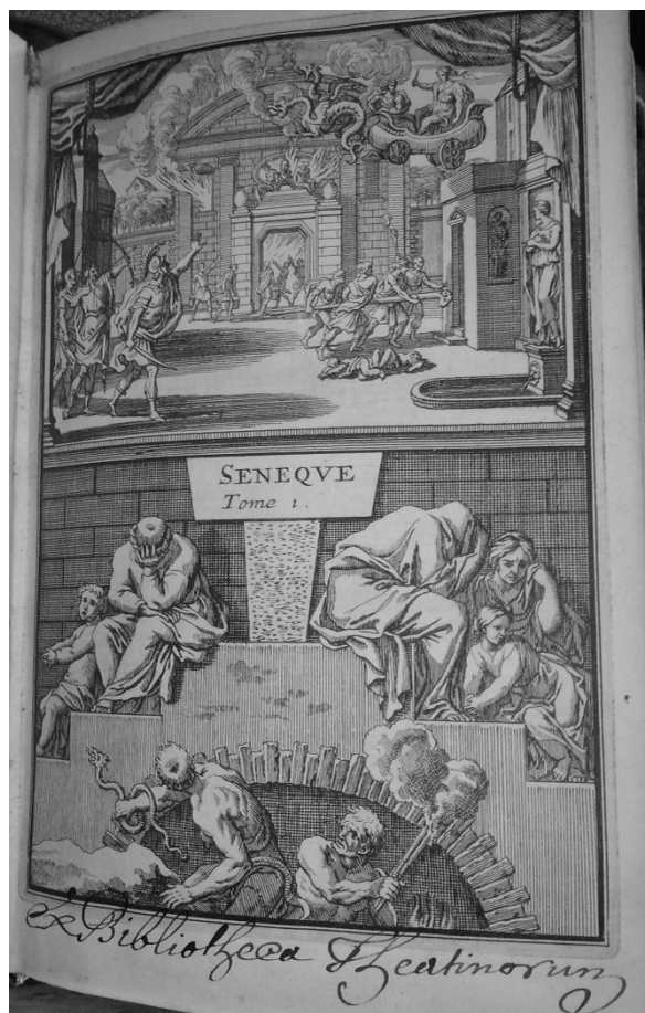
Figure 3. De Marolles, L. Annaei Senecae Tragoediarum tomus prior [-alter] cum notis & interpretatione gallica M. de Marolles Abb. de Villalupa. Les Tragedies de Senecque, en latin et en francois, de la traduction de M. de Marolles abbé de Villeloin. Avec des remarques nécessaires sur les lieux difficiles , par Antoine Chrestien, Paris, 1659-1664, page de titre, BU Arsenal, Université Toulouse 1 Capitole, Res Mn 88860.