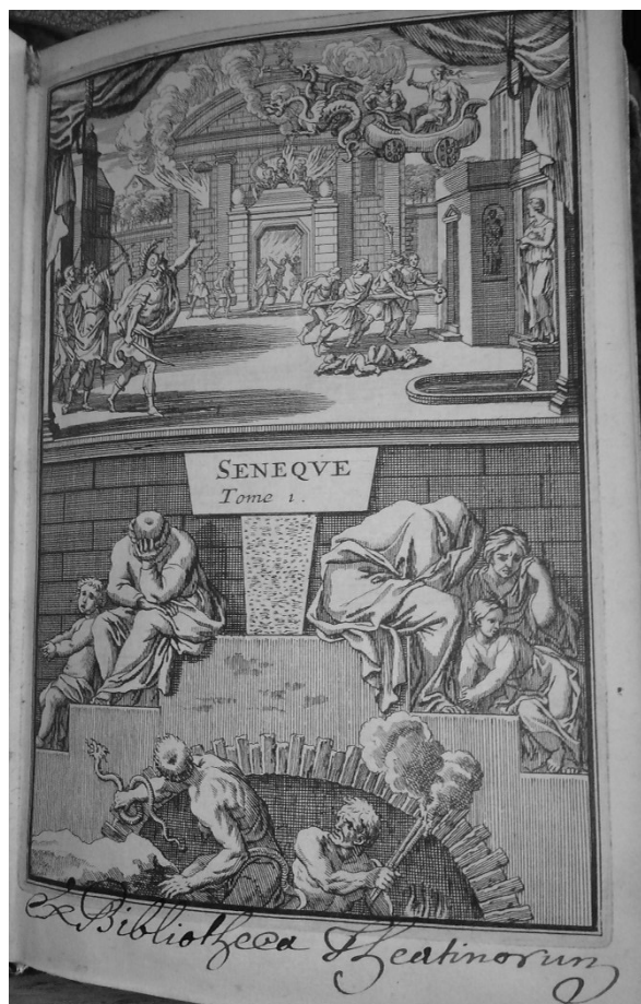
Figure 3. De Marolles, L. Annaei Senecae Tragoediarum tomus prior [-alter] cum notis & interpretatione gallica M. de Marolles Abb. de Villalupa. Les Tragedies de Senecque, en latin et en francois, de la traduction de M. de Marolles abbé de Villeloin. Avec des remarques nécessaires sur les lieux difficiles , par Antoine Chrestien, Paris, 1659-1664, page de titre, BU Arsenal, Université Toulouse 1 Capitole, Res Mn 88860.