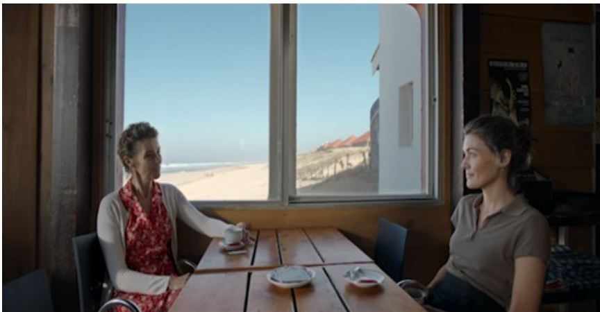
Figura 7. Madre [DVD], Cherry Pickers Filmdistributie B.V., 2020.

se empeña en entablar amistad con la exnovia de Jean en un episodio nocturno que esboza el motivo del triángulo amoroso, hasta que la adolescente, turbada por el diálogo visual de los dos protagonistas, deja el campo. Más adelante, Elena sufre durante su servicio las intimidaciones de la madre de Jean; el deslizamiento de la cordialidad superficial hacia el enfrentamiento abierto está figurado a nivel filmico por el campo-contracampo disociativo al que deja paso el cara a cara entre las dos mujeres inicialmente reunidas en el campo 27 (Figura 7).