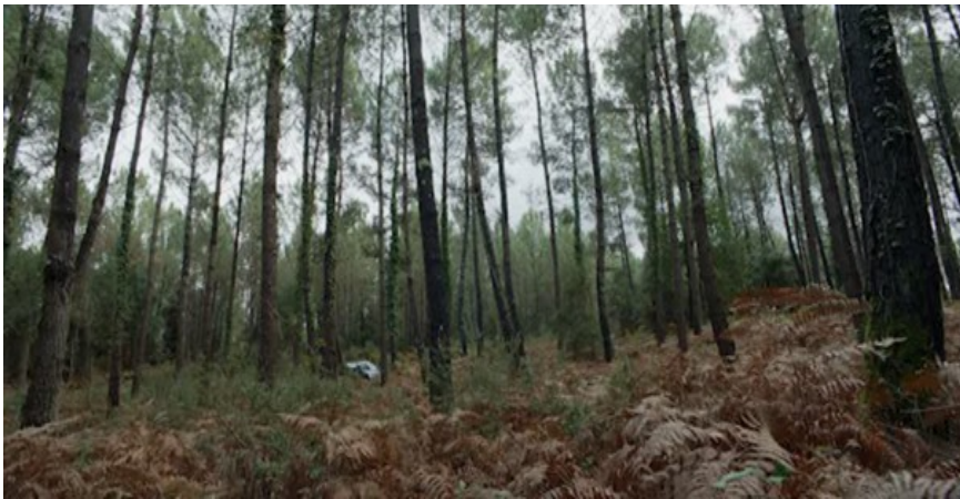
Figura 11. Madre [DVD], Cherry Pickers Filmdistributie B.V., 2020.

dear cada evolución, se clausura, como ya se ha mencionado, con una emocionante despedida en el coche de Elena, en medio del bosque de pinos, durante un episodio que propone otra interesante declinación de la dialéctica campo/fuera de campo. La dualidad anteriormente analizada vuelve a aparecer aquí mediante la ubicación del vehículo, simbólicamente aparcado en la encrucijada de dos senderos, cuando cada uno de los dos protagonistas se encuentra en un cruce de caminos: aceptar quizás no volver a ver a Elena para Jean, salir por fin del luto para Elena. Aunque un plano medio corto fijo muestra los primeros besos y caricias que se dan ambos personajes dentro del coche, se oculta el resto de la escena a la mirada del público extradiegético, rechazado con la cámara fuera del habitáculo, entre los helechos (Figura 11).