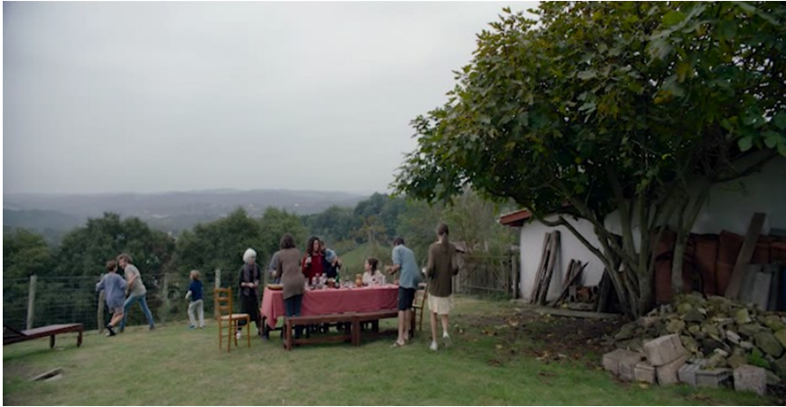
Figura 9. Madre [DVD], Cherry Pickers Filmdistributie B.V., 2020.