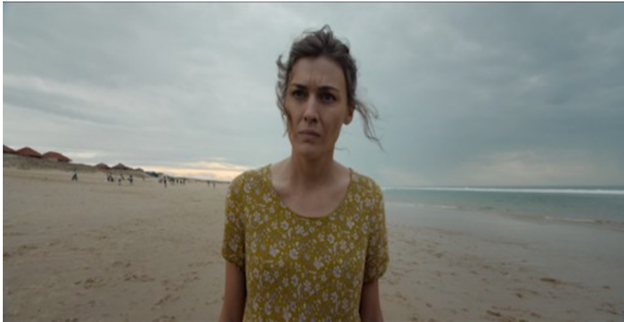
Figura 5. Madre [DVD], Cherry Pickers Filmdistributie B.V., 2020.