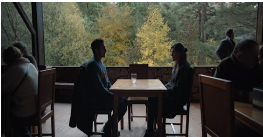
Figura 10. Madre [DVD], Cherry Pickers Filmdistributie B.V., 2020.