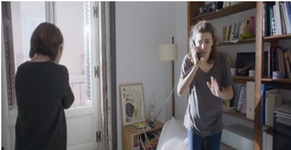
Figura 2. Madre [DVD], Cherry Pickers Filmdistributie B.V., 2020.

el piso, paradójicamente bañado de luz, y se restringe progresivamente alrededor de Elena, colgada al teléfono (Figura 2). Esta secuencia es probablemente la que explora más explícitamente las “articulaciones posibles entre un aquí y un ahí, destinado a convertirse a su vez en un aquí”, en las que, a ojos de André Gaudreault y François Jost, “reside buena parte del potencial narrativo del cine” 10 . De hecho, el creciente suspense que estructura el primer cuarto de hora de Madre estriba en la tensión instalada por el director entre el campo y el fuera de campo merced a la fuerza de evocación del espacio marítimo que se hace invisible más allá del plano de apertura, ese “ahí” destinado a convertirse en el “aquí” donde se anclará más adelante la diégesis para representar la difícil reconstrucción de la madre enlutada.