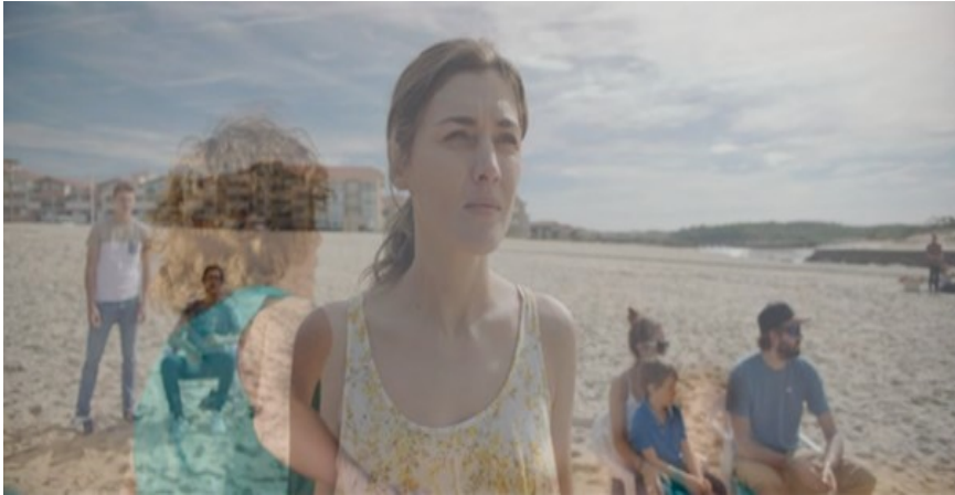
Figura 6. Madre [DVD], Cherry Pickers Filmdistributie B.V., 2020.

contracampos del joven observado a sus espaldas mientras hace deporte o también el procedimiento de sobreimpresión (Figure 6).