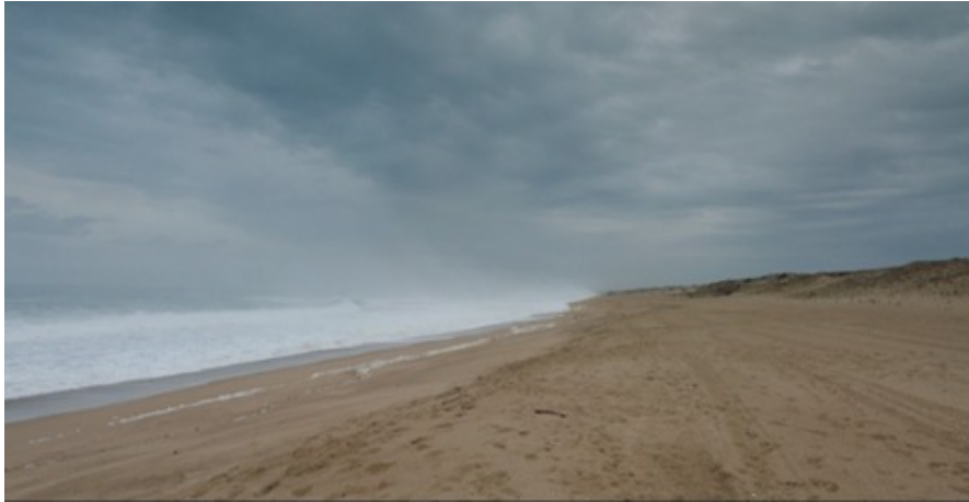
Figura 1. Madre [DVD], Cherry Pickers Filmdistributie B.V., 2020.

rante, a la vez visual y narrativo, del texto fílmico: el prólogo que constituye el corto original se abre con un plano general fijo de un día nublado en una playa salvaje y desierta, acompañado por el sonido regular de la resaca (Figura 1) 7 .