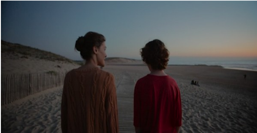
Figura 8. Madre [DVD], Cherry Pickers Filmdistributie B.V., 2020.

de la costa). Se muestra entonces como lugar construido, equipado, provisto de ganibelas 28 destinadas a contrarrestar la fuerza de la arena y las olas (Figura 8). Esas tablillas de madera típicas de las barreras girondinas permiten asimismo luchar contra una erosión que, en un segundo nivel de lectura, metaforiza de forma obvia el luto de Elena mientras ella inicia un paulatino proceso de reparación buscando la compañía de los jóvenes veraneantes (Jean y sus amigos pero también los noctámbulos de la discoteca): en este sentido, la playa, eje destacado del dispositivo semiológico creado por el relato, se puede contemplar como “un lugar de las imágenes, perceptivo y luego representativo” tal y como lo entiende Jean-Yves Tadié en su Récit poétique 29 .