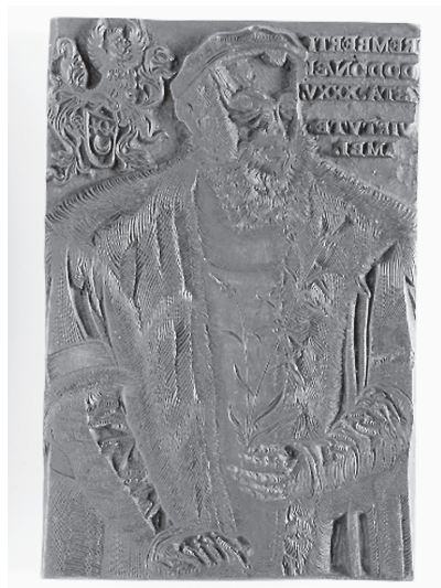
Fig. 6 : le bois gravé qui sert au portrait ( https://dams.antwerpen.be/asset/u2OXrmVTYQUhKGh7kbXWnwRs ). Crédit : Museum Plantin-Moretus, Antwerp - UNESCO, World Heritage 1 .

De telles combinaisons n'étaient pas rares dans des domaines «à la mode», et on trouve des exemples de cette pratique chez Plantin comme chez ses concurrents. En témoigne l'écheveau de contrefaçons et d'éditions hybrides qui suivirent la publication en 1543 chez Oporinus à Bâle du De humani corporis fabrica et de son Epitome d'André Vésale (1515-1564). Les avatars de leur succession, la destinée des textes et des illustrations sont connus 46 . En 1545, un Liégeois Geminus publia à Londres un traité reprenant le texte de l' Epitome illustré de 40 planches de la Fabrica gravées sur cuivre, l'ensemble étant intitulé Compendiosa totius anatomes delineatio . L'imprimeur parisien André Wechel racheta les matrices en cuivre entre 1559 et 1664 et publia en 1565 une nouvelle version, corrigée par le médecin et poète français Jacques Grévin sous le titre Anatomes totius ære insculpta delineatio , et en 1569, une traduction française sous le titre Les portraits anatomiques de toutes les parties