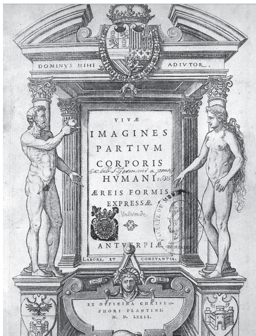
Fig. 7 : Page de titre des Vivæ imagines ( https://www.biusante.parisdescartes.fr/histmed/image?00595 ) (BIU Santé. Licence ouverte/Open Licence).

planches de 1566 et une lettre en flamand de l'imprimeur adressée aux apprentis médecins et chirurgiens qui ignoraient le latin.