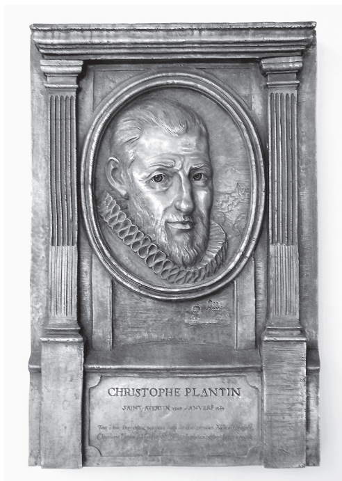
Fig 1 : plaque de bronze gravée par E. Sellier sur les murs de l'école C. Plantin à Saint-Avertin.