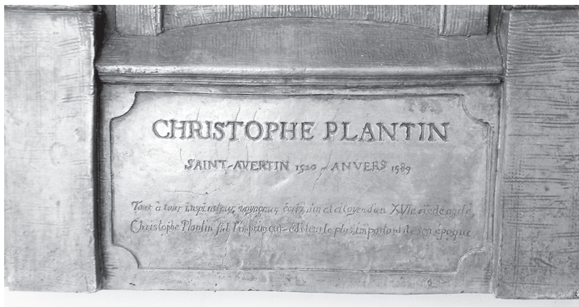
Fig. 2 : détail.