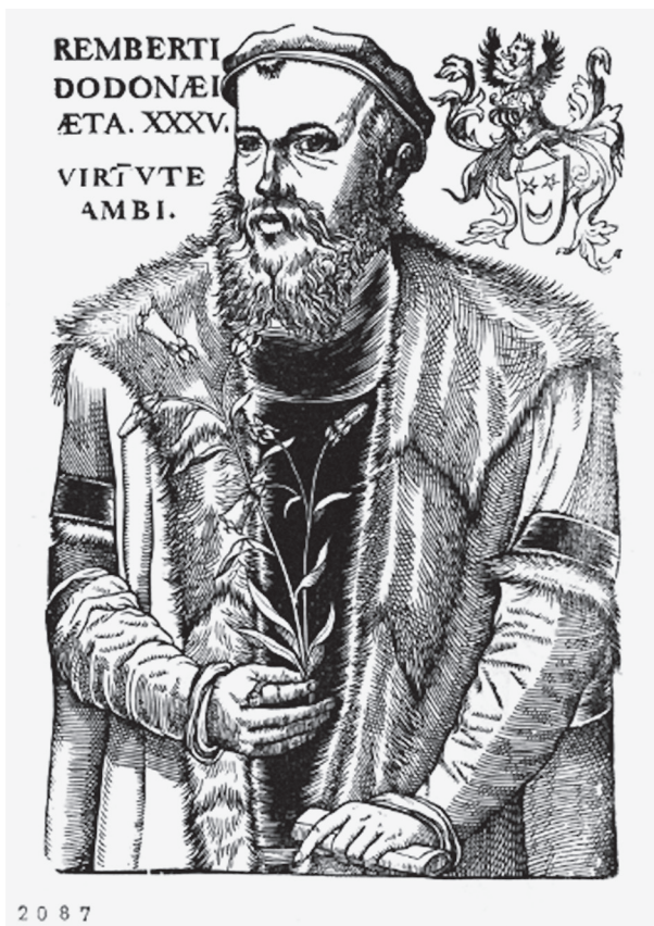
Fig. 5 : Rembert Dodoens à la moitié de sa vie ( https://dams.antwerpen.be/asset/C1HaPrUucNVf9tDhbVn51K89/wKRfJX8IWgXkM5WPrt2lxju ). Crédit : Museum Plantin-Moretus (Printroom collection), Antwerp - UNESCO, World Heritage '.

à Vienne et y devint médecin aulique. Il y retrouva Charles de l'Écluse qui dirigeait le jardin impérial et qui avait traduit en français le Cruijdeboeck en 1557 43 , avant d'obtenir une chaire à l'université de Leyde peu après 1580.