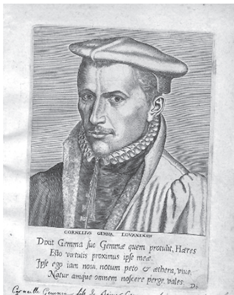
Fig. 4 : Cornelius Gemma ( https://dams.antwerpen.be/asset/nBBDNrWvKPhpcFgKNVQ9IIne/X24wVDbicCCXRjPRWdMMeRSm ). Crédit : Museum Plantin-Moretus (Printroom collection), Antwerp - UNESCO, World Heritage'.

figura ac magnitudine anno 1577, per D. Cornelium Gemmam, Lovaniensem, ordin. Ac regium medicinae professorem, Antwerpiæ, ex officina Christophori Plantini, architypographi regii (Fig. 4).