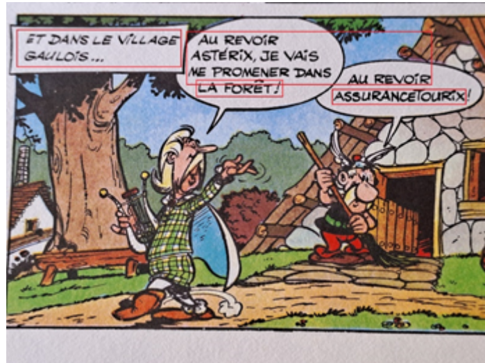
FIG. 3 – Exemple de bulles se chevauchant, où un mauvais regroupement de blocs de textes peut s’opérer

(Comic Book Markup Language) présenté dans Walsh (2012), nous avons dans un premier temps opté pour une version brute ne faisant apparaître que les texte bruts.