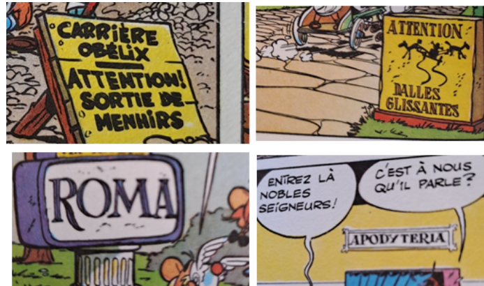
FIG. 6 – Image présentant des éléments textuels de décor