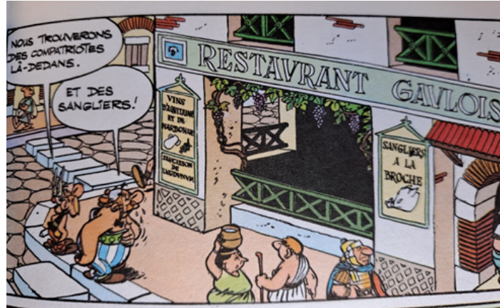
FIG. 4 – Image présentant multiples textes dans le décor