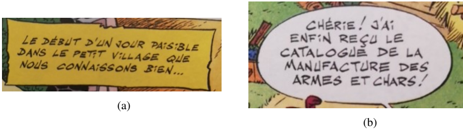
FIG. 1 – Exemples de bulles de bandes dessinées