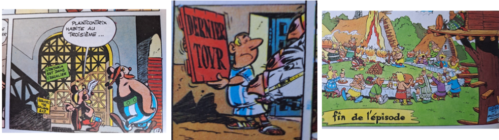
FIG. 5 – Images présentant des éléments textuels de décor