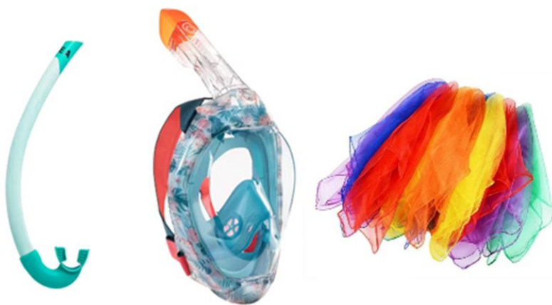
Figure 1 – Exemple de tuba, masque scaphandre et foulards utilisés en phase 2

Les masques de type scaphandre permettent de libérer le non nageur d'une respiration aquatique (via un tuba avec double système de valves anti-retour permettant de conserver sa respiration de terrien). Ils offrent la possibilité de lutter progressivement contre les peurs liées à l'engloutissement (hors de l'eau allongé sur un matelas puis dans l'eau, petite puis progressivement grande profondeur, avec des jeux de signaux, puis des objets à saisir). La possibilité de voir le fond sans obstruction du champ visuel comme avec des masques traditionnels et sans avoir à gérer la respiration est un plus pour cibler et isoler le phobogène. La limite de cet outil est qu'il n'est pas conçu pour les apnées et qu'au-delà de 2m de profondeur l'eau pourra entrer dans le masque.