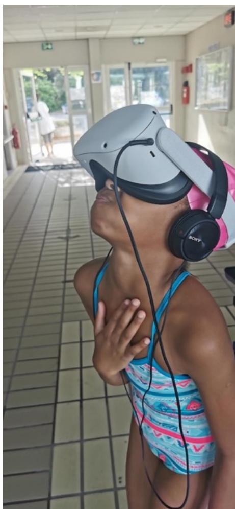
Figure 3 – Elève non-nageur avec masque RV en atelier phase 3

Les masques RV n'ayant pas encore de caractéristiques permettant de les utiliser dans l'eau, ils sont utilisés de deux façons dans notre démarche. Soit lors d'ateliers dédiés qui vont se dérouler hors bassin avec (Figure 2) ou sans ordinateur portable (Figure 3) selon le type de matériel utilisé.