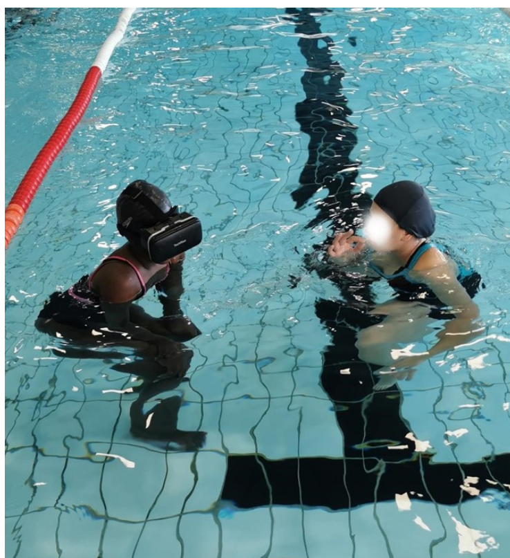
Figure 4 – Elèves non-nageur avec supports de smartphone IP68

Notre démarche peut être synthétisée dans un organigramme (figure 5) montrant sa progressivité.