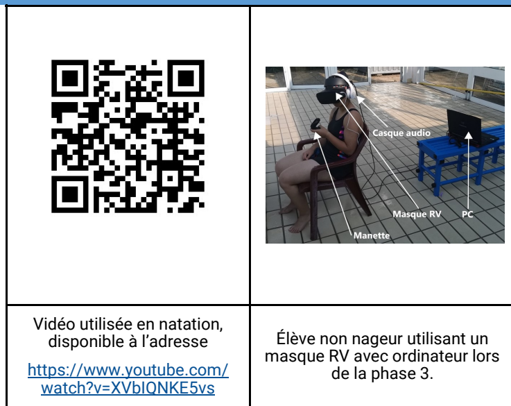
Figure 2 – Dispositif mis en place en bord de bassin

Soit en petite ou moyenne profondeur avec des masques supports et smartphones, aux normes IP 67 ou IP 68 tolérant une immersion accidentelle jusqu'à 3 mètres (Figure 4).