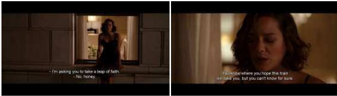
Inception (Nolan, 2010) ; captures d'écran

Mais le sort de Mal ne fait pas qu'illustrer cinématographiquement la relation « interne », logique entre scepticisme et fanatisme. En effet, une attention supplémentaire aux circonstances dans lesquelles Mal en est venue à adopter cette perspective fanatique sur le monde se révèle instructive. Il est clair que le responsable du suicide de Mal à l'hôtel est Cobb, dans la mesure où, pour la faire quitter les limbes, il a dû lui implanter l'idée que ce que Mal prenait pour le réel n'était en fait qu'un rêve dont on ne peut sortir qu'en se suicidant, une « inception » qui a si bien fonctionné qu'elle l'a empêchée, une fois de retour dans le monde réel, de « s'y retrouver », c'est-à-dire de ne pas tenir le réel pour un rêve. Autrement dit, pour implanter cette idée dans l'esprit de Mal, Cobb a dû lui faire perdre le sens de la réalité en la privant des mots pour décrire son expérience du monde, afin de leur substituer des mots qui ne peuvent que dévaloriser l'existant au profit de l'idéal que l'on n'atteint que par la mort.