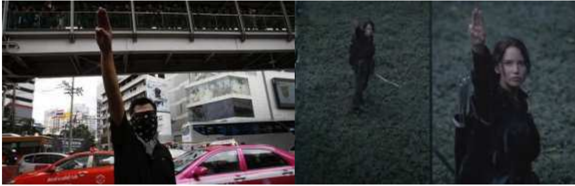
Bangkok, le 1er juin 2014. The Hunger Games (Gary Ross, 2012) ; captures d'écran

Connu depuis longtemps, puisque Marcel Mauss n'utilise pas un autre exemple que le cinéma pour rendre compte des circonstances dans lesquelles l'idée célèbre de « techniques du corps » lui est venue 2 , ce phénomène de mimétisme cinématographique ne concerne malheureusement pas que les partisans des libertés publiques et de la démocratie : une réflexion semblable sur l'artificialisation cinématographique des conduites terroristes à partir du cinéma populaire pourrait en effet s'appuyer sur nombre de ressemblances frappantes entre violence réelle et violence cinématographique. Pour ne s'en tenir qu'à deux exemples, la séquence récente du massacre d'Orlando aux États-Unis (11 juin 2016) suivi des meurtres du couple de policiers à leur domicile de Magnanville en France (13 juin 2016) rappelle la façon dont le Terminator (Cameron, 1984) fait irruption dans un night-club , attaque un commissariat et attend l'appel téléphonique de sa victime au domicile de sa mère, de même que le modus operandi de Mohammed Merah (mars 2012) semble imité de celui du personnage principal de son film préféré 3 : Faster (George Tillman Jr., 2010).