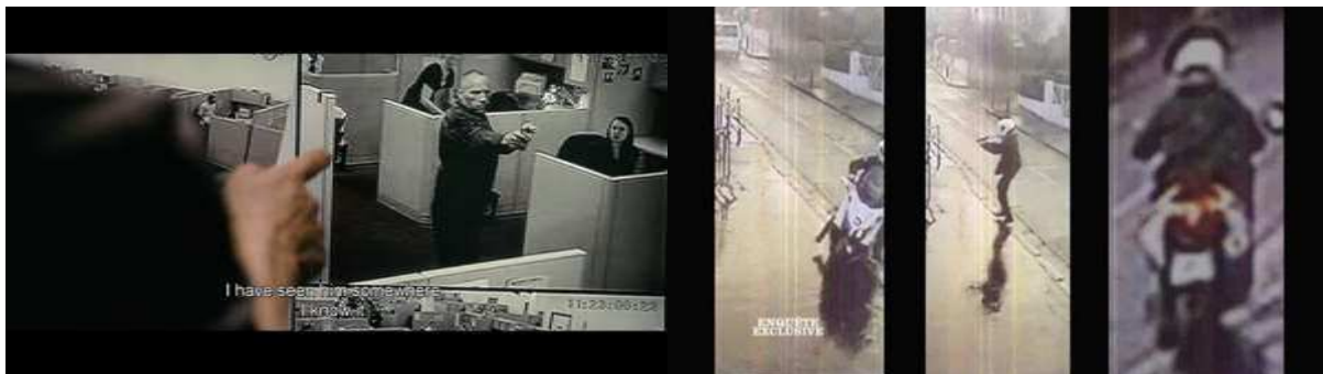
Faster (George Tillman Jr., 2010) ; expédition de Merah (mars 2012) ; captures d'écran

Connu depuis longtemps, puisque Marcel Mauss n'utilise pas un autre exemple que le cinéma pour rendre compte des circonstances dans lesquelles l'idée célèbre de « techniques du corps » lui est venue 2 , ce phénomène de mimétisme cinématographique ne concerne malheureusement pas que les partisans des libertés publiques et de la démocratie : une réflexion semblable sur l'artificialisation cinématographique des conduites terroristes à partir du cinéma populaire pourrait en effet s'appuyer sur nombre de ressemblances frappantes entre violence réelle et violence cinématographique. Pour ne s'en tenir qu'à deux exemples, la séquence récente du massacre d'Orlando aux États-Unis (11 juin 2016) suivi des meurtres du couple de policiers à leur domicile de Magnanville en France (13 juin 2016) rappelle la façon dont le Terminator (Cameron, 1984) fait irruption dans un night-club , attaque un commissariat et attend l'appel téléphonique de sa victime au domicile de sa mère, de même que le modus operandi de Mohammed Merah (mars 2012) semble imité de celui du personnage principal de son film préféré 3 : Faster (George Tillman Jr., 2010).