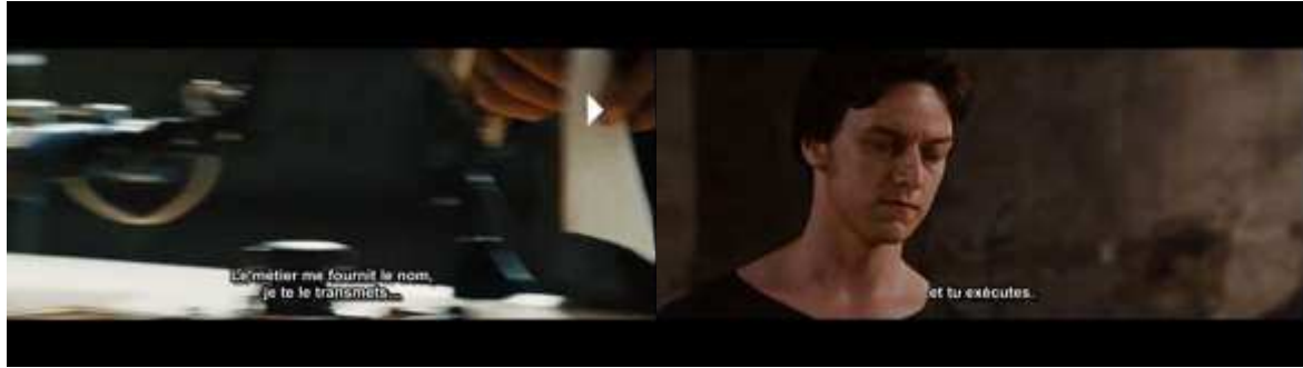
Wanted (Bekmambetov, 2008); captures d'écran

L'un des intérêts du texte de Mulhall est de mettre en évidence l'existence d'un rapport d'analogie entre la façon dont le métier à tisser, en donnant le nom des victimes, écrit le destin du monde et la façon dont l'imagerie numérique transforme le cinéma. S'il n'est pas possible de rentrer ici dans les détails, Mulhall en conclut que de même que l'interprète du métier à tisser, Sloan, le chef de la Confrérie, peut faire que la machine donne n'importe quel nom propre, de même peut-on simuler n'importe quelle donnée visuelle à l'aide de séquences de nombres. Les images numériquement créées n'ont en effet pas de rapport nécessaire avec les données visuelles captées par l'objectif de la caméra, une opération de captation dont on peut d'ailleurs et pour cette raison se passer techniquement. Dans le film, lorsque Wesley prend conscience de la supercherie, sa réaction est d'assassiner Sloan pour prendre sa place et changer la réalité en la façonnant selon ses désirs. Mulhall interprète ce choix comme signifiant que, pour le spectateur de cinéma, l'hypperréalisme de l'image numérique a pour résultat