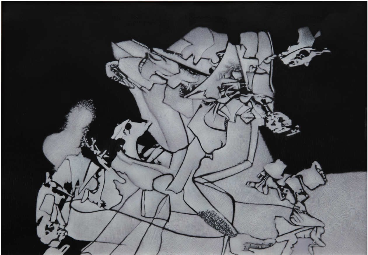
Pierre Cazes, Sans titre , 30 X40, 2000.

Enfin, il existe des différences dans les dire et l'être, dans le symbolique et les autres sens possibles. La communication permet la structuration d'une pensée et lui permet par l'articulation des symboles d'atteindre une complexité et une abstraction qui fait que l'être humain s'est hissé à un développement technique, symbolique, jamais égalé dans le règne du vivant. Grâce à la mémoire qui se loge dans le système symbolique, le langage commun permet aux sociétés d'évoluer, seulement le mot ne propose pas suffisamment de possibles pour percevoir l'être. En ce sens l'art est nécessité, car il permet à chacun de pouvoir imaginer à partir des signes que propose l'artiste, un autre monde symbolique celui qui dialogue entre la pensée singulière et l'œuvre d'art. L'œuvre permet cette réouverture symbolique, permet de recouvrer un monde avant le verbe, où le possible peut advenir.