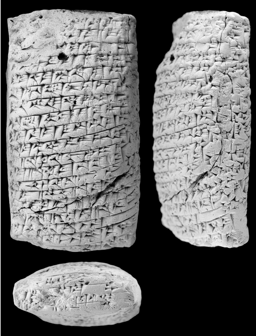
Fig. 2. A.1186 revers et tranche supérieure.