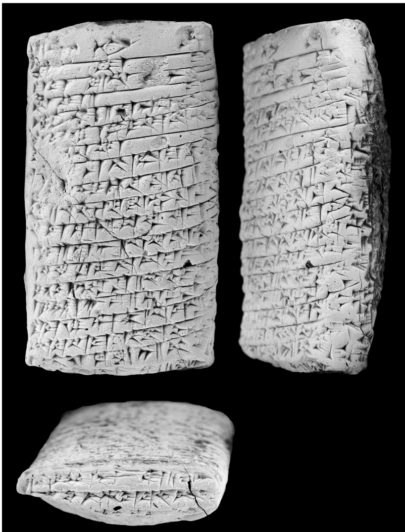
Fig. 1. A.1186 face et tranche inférieure (montage F. Nebiolo).