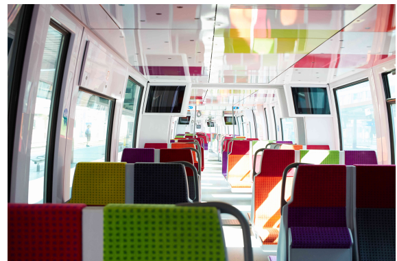
FIGURE 1 – À gauche, affichage déployé dans certaines gares de la charge à bord par zone ; à droite, un exemple de l'intérieur d'une rame communicante.

Revue de la littérature. Pour éviter ce problème, de nombreux opérateurs de transport privilégient une mesure directe de la charge à bord à l'aide de caméras vidéos ou de capteurs de pression. Par exemple, la société Thales (2021) utilise à Londres des caméras de vidéosurveillance natives pour mesurer le volume de voyageurs. Certains opérateurs à Copenhague (Nielsen et al., 2014), Stockholm (Zhang et al., 2017), Londres (Schmitt, 2017; Rogers, 2019) ou Singapour (Ngauw, 2018) privilégient une mesure semi-directe par la masse à l'essieu en utilisant des capteurs de pression au niveau des essieux.