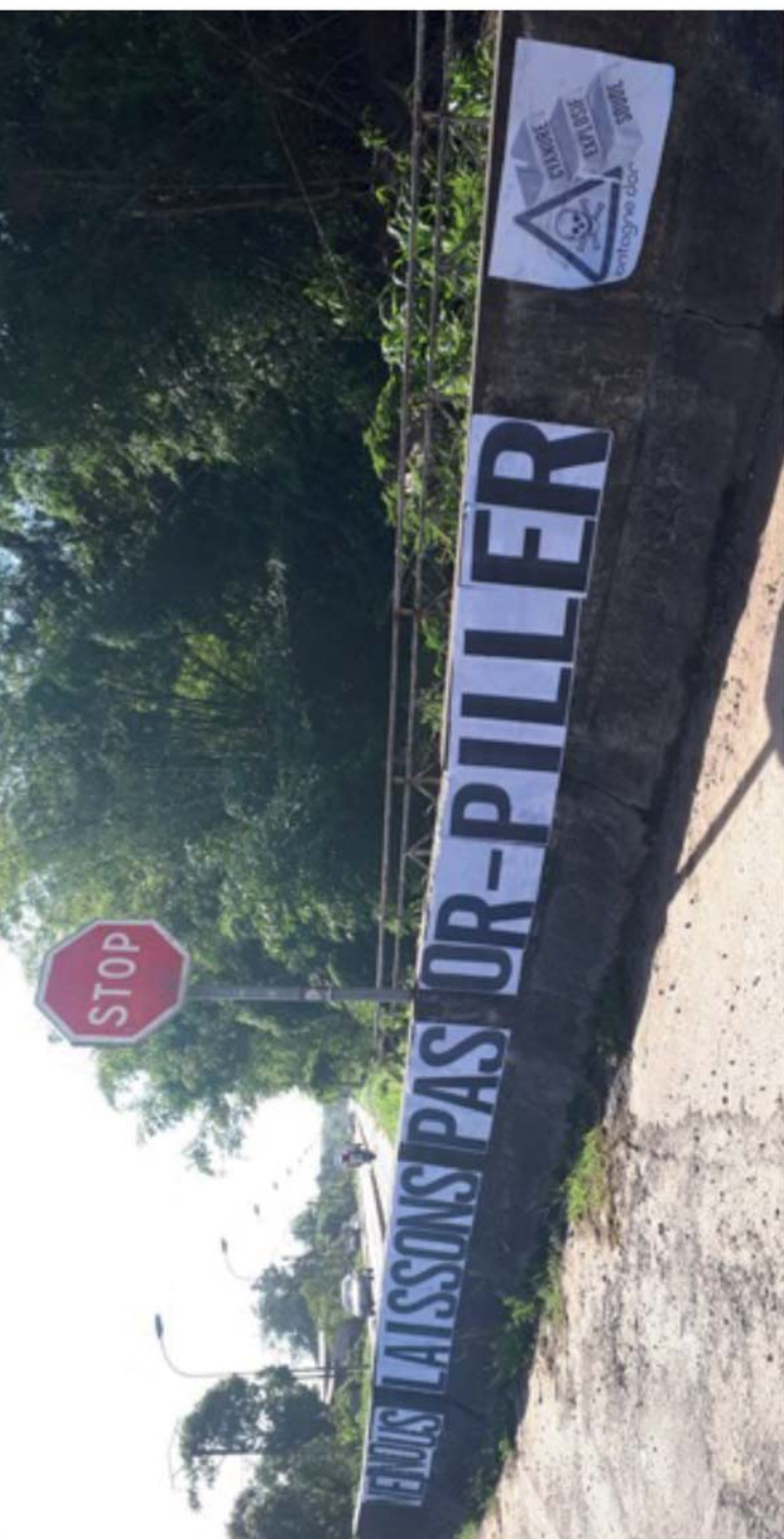
Affiches et tags d'opposants aux activités extractivistes sur les murs de St Laurent-du-Maroni. Photographies par Matthieu Noucher, mars 2019.