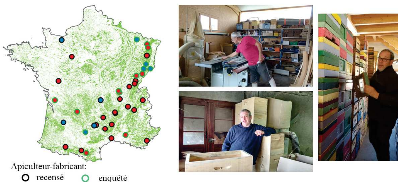
Figure 1. Localisation des apiculteurs-fabricants de ruches identifiés en France. En rouge, il s'agit d'apiculteurs dont le revenu principal est celui de l'apiculture, en bleu : ce n'est pas le cas. Photos d'ateliers et de stockage de menuiserie apicole.

relève d'une logique de proche en proche et d'un principe de saturation de l'information (Olivier de Sardan, 1995). Au total, douze individus ont été retenus pour l'analyse dont huit apiculteurs et quatre fabricants vendeurs localisés dans des «régions de bois» (massifs de Vosges, du Jura, Montagne Noire, Monts du Lyonnais, Clunisois). Ces entretiens présentent une diversité de profils, de parcours et de lieux de vie ( figure 2 ). Tous les individus ont été volontaires pour participer à cette enquête : les uns avaient répondu aux annonces que nous avons diffusées dans des journaux professionnels apicoles nationaux (Abeilles et Fleurs n° 831, L'Abeille de France n° 1077), d'autres ont été rencontrés après avoir été identifiés et proposés par leurs pairs. Nos entretiens ont été enregistrés avec leur accord puis retranscrits pour faire l'objet d'une analyse de discours thématique. La trame des questions, issue d'une première enquête, s'est adaptée aux situations. Les apiculteurs nous ont tous reçus dans leur atelier, lieu de fabrication visible alors que la fabrication des ruches présentes sur le marché est rendue invisible car délocalisée dans des pays où la main d'œuvre est bon marché (Duplex et al. , 2020). Pour rester fidèles à leurs pensées, nous utilisons ici le plus souvent possible les termes et expressions recueillis en entretien, mis entre guillemets.