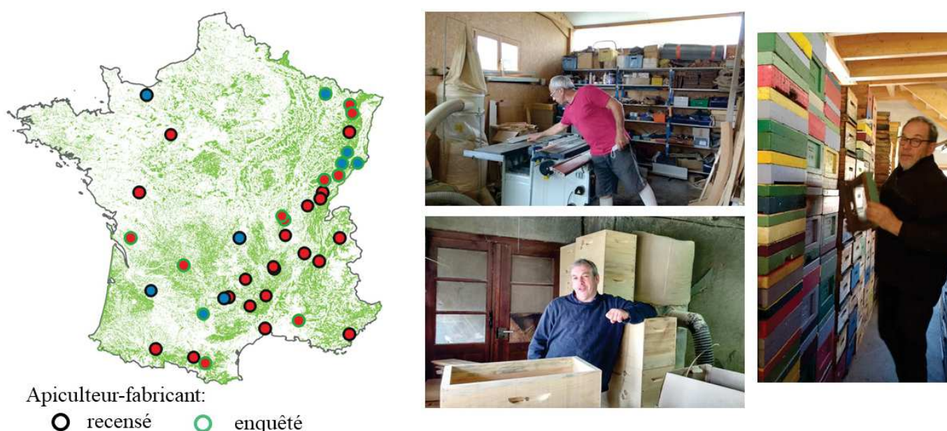
Figure 1. Localisation des apiculteurs-fabricants de ruches identifiés en France. En rouge, il s'agit d'apiculteurs dont le revenu principal est celui de l'apiculture, en bleu : ce n'est pas le cas. Photos d'ateliers et de stockage de menuiserie apicole.

relève d'une logique de proche en proche et d'un principe de saturation de l'information (Olivier de Sardan, 1995). Au total, douze individus ont été retenus pour l'analyse dont huit apiculteurs et quatre fabricants vendeurs localisés dans des «régions de bois» (massifs de Vosges, du Jura, Montagne Noire, Monts du Lyonnais, Clunisois). Ces entretiens présentent une diversité de profils, de parcours et de lieux de vie ( figure 2 ). Tous les individus ont été volontaires pour participer à cette enquête : les uns avaient répondu aux annonces que nous avons diffusées dans des journaux professionnels apicoles nationaux (Abeilles et Fleurs n° 831, L'Abeille de France n° 1077), d'autres ont été rencontrés après avoir été identifiés et proposés par leurs pairs. Nos entretiens ont été enregistrés avec leur accord puis retranscrits pour faire l'objet d'une analyse de discours thématique. La trame des questions, issue d'une première enquête, s'est adaptée aux situations. Les apiculteurs nous ont tous reçus dans leur atelier, lieu de fabrication visible alors que la fabrication des ruches présentes sur le marché est rendue invisible car délocalisée dans des pays où la main d'œuvre est bon marché (Duplex et al. , 2020). Pour rester fidèles à leurs pensées, nous utilisons ici le plus souvent possible les termes et expressions recueillis en entretien, mis entre guillemets.