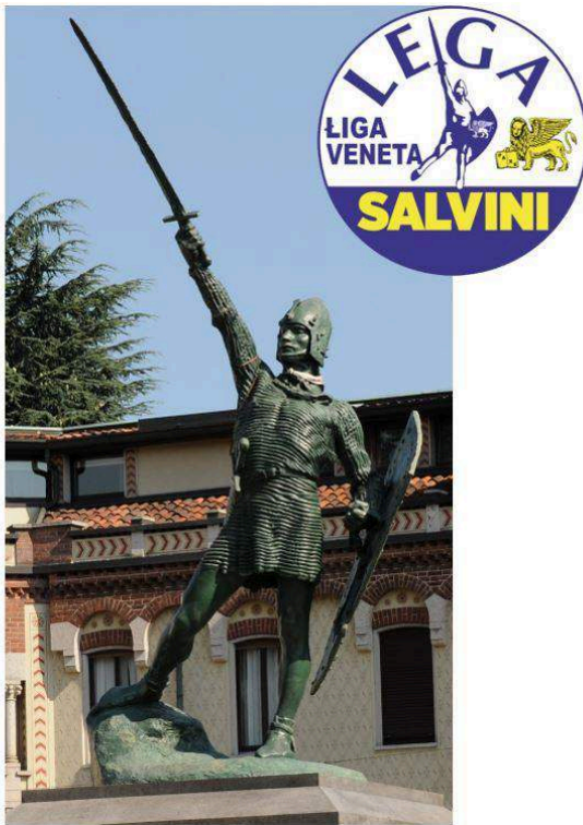
Photo: AlfaLancia, CC BY-SA 3.0, via Wikimedia Commons Logo: LigaVeneta, CC BY-SA 4.0, via Wikimedia Commons

Montage réalisé à partir de la statue d'Alberto Da Giussano à Legnano (Lombardie) et du logo de la Ligue vénète